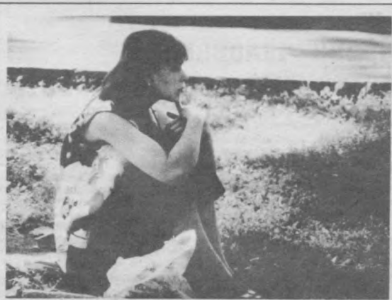
«Интересно, что он скажет в свое оправдание на этот раз?..»