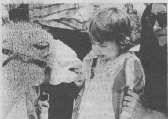
Хочешь вкусенького?