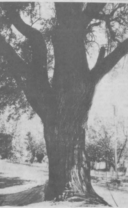
Патриарх.