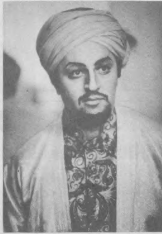
ни все в жизни подчинить служению муз.

— А с какого концерта вы ведете отчет своей музыкальной биографии?