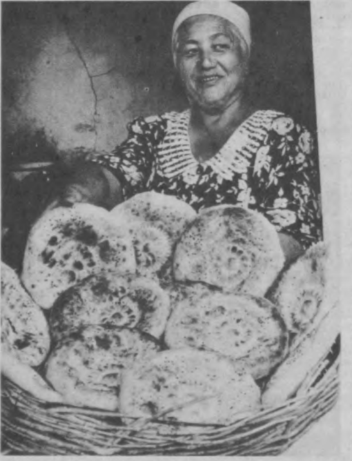
Словно горячее ташкентское солнце...