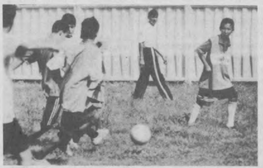
Начни с победы

Да, верно поется в Олимпийском гимне: «О спорт, ты — мир». Целый мир старей, предпечений, радости и печали. Мир человеческих чувств, где на первом плане — устремление, выдержка, азарт борьбы и воля к победе. Воспитавший в себе эти качества не только на спортивной площадке, но и в жизни добьется успеха.