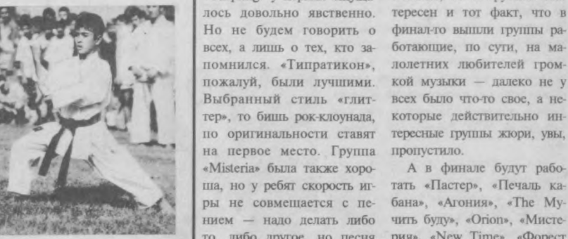
Записки фанатеющей девушки