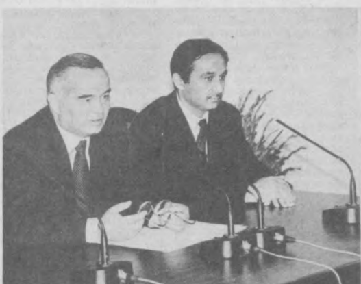
Республики Узбекистан Ислам Каримов.