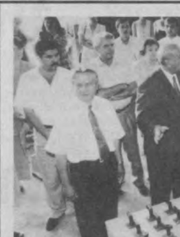
В русле реформ

В Сабир-Рахимовском районе Ташкента на днях состоялось торжественное открытие академического лицея востоковедения. Здание лицея, подвергнувшееся глобальной реконструкции, полностью изменило свой облик — были проведены электромонтажные, сантехнические, отделочные работы, произведено усиление стенков. Затраты на изменение конструкции составили 240 миллионов сумов, и, глядя на обновленное здание, сверкающее свежими окнами, можно заметить, что деньги вложены не зря. К тому же помимо учебных корпусов на территории расположены столовая, спортивный зал, стадион, теннисный корт.