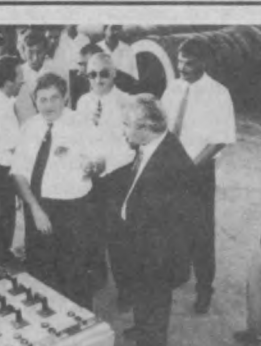
И трубы будут свои

В субботу в Сергелийском районе Ташкента произошло событие, которое, несомненно, послужит укреплению промышленности республики — был пущен первый в Узбекистане трубопрокатный стан.