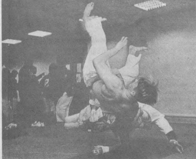
НА СНИМКАХ: бросок; на тренировке.

По материалам печати и информационных агентств.