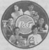
Качество — лучшая экономия!