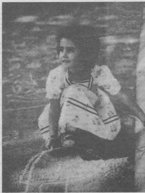
Точка, точка, запятая...