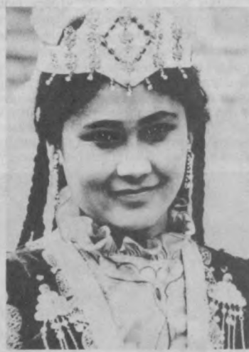
Улыбка Ширина.

Ходжа Ахмад Яссави жил и творил в середине XII века.