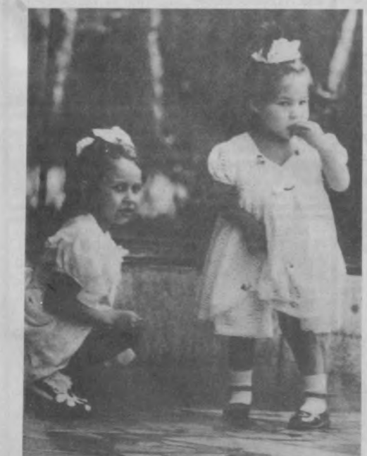
Подружки на прогулке.