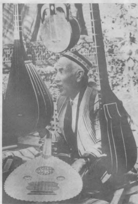
Разговор с еще не зазвучавшей музыкой.