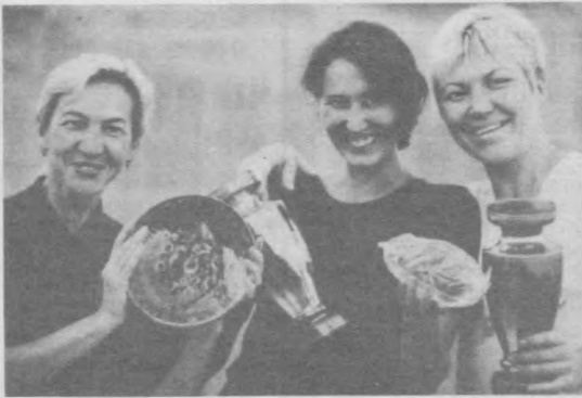
1999-й -- Год женщин