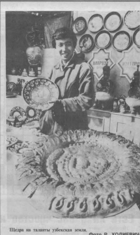
Щедра на таланты узбекская земля.

— Интересно, а как вы представляете свое искусство за рубежом, объ-