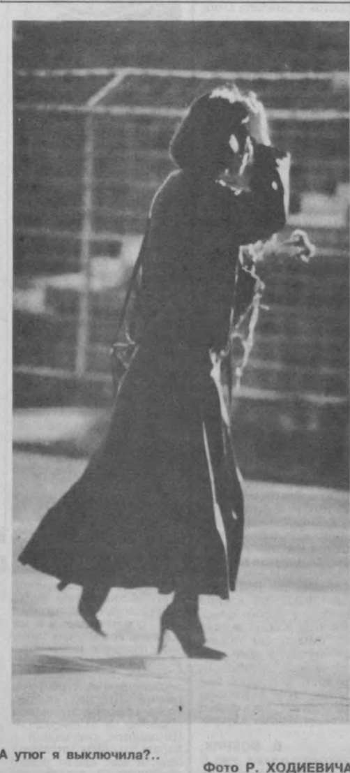
А уют я выключила?..

состоялся мой дебют. Это произошло на республиканском музыкальном конкурсе, где я заняла второе место по вокалу и третье -- по фортепиано. Думаю, что именно это событие послужило толчком к дальнейшему завоеванию музыкальных высот. Тогда я была вдохновлена успехом. Но неожиданно, после семи лет учебы, мне пришла мысль, что, наверное, у меня нет способностей соответствующего уровня. Все время что-то не удовлетворяло, и я бросила музыкальную школу. Но потом поняла, что отказать можно только от чего-то несущественного, случайного в твоей жизни. А к музыке меня тянуло всей душой. И после окончания школы я поступила на подготовительное отделение Ташкентской государственной консерватории. А после окончания консерватории осталась в аспирантуре, защитила диссертацию на тему «Орфоэпия в пении» и теперь работаю на кафедре концертмейстерского искусства.