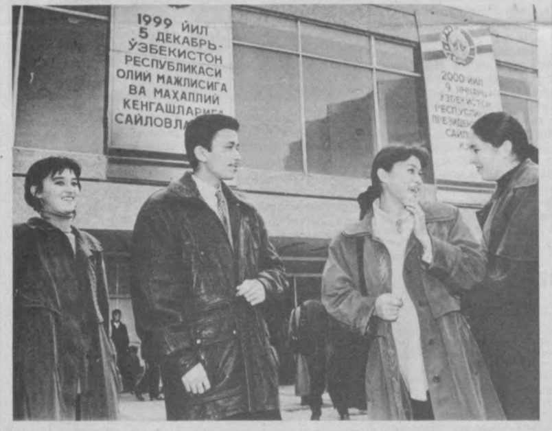
Будущее страны зависит от них...