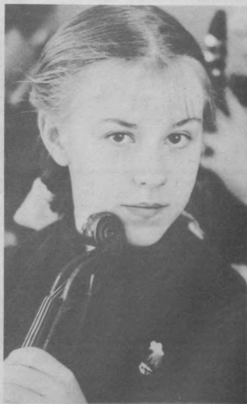
А. ВОЛОКО. Приобщение к музыке.

На вечере присутствовал Чрезвычайный и Полномочный Посол Индии в Узбекистане г-н Б. К. Митра.