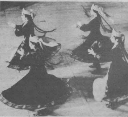
В вихре танца.