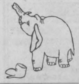
Рисунок Никиты СЛАВГОРОДСКОГО.

Слон шагает по дороге, Отчего он босоног? На свои большие ноги Он сапог Найти не мог!