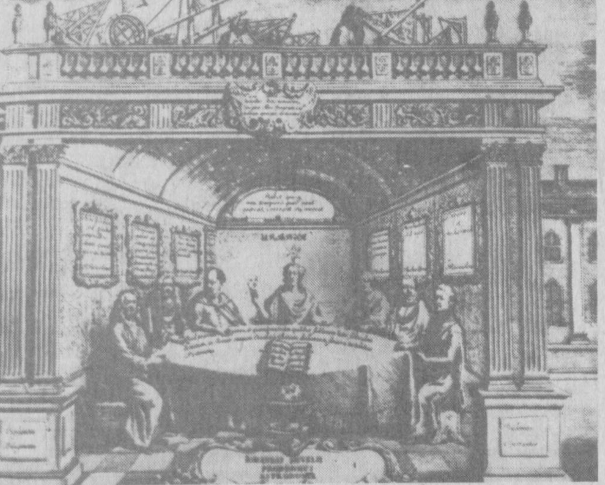
Мирзо Улугбек жаҳон астрономлари даврасида. Гравюрадан нусха.

Улугбек ҳақида Вашингтон ва Лондонда чоп этилган китоблардан нусхалар. Суратлари А. ТУРАЕВ ва Т. НОРКУЛОВлар туширган.