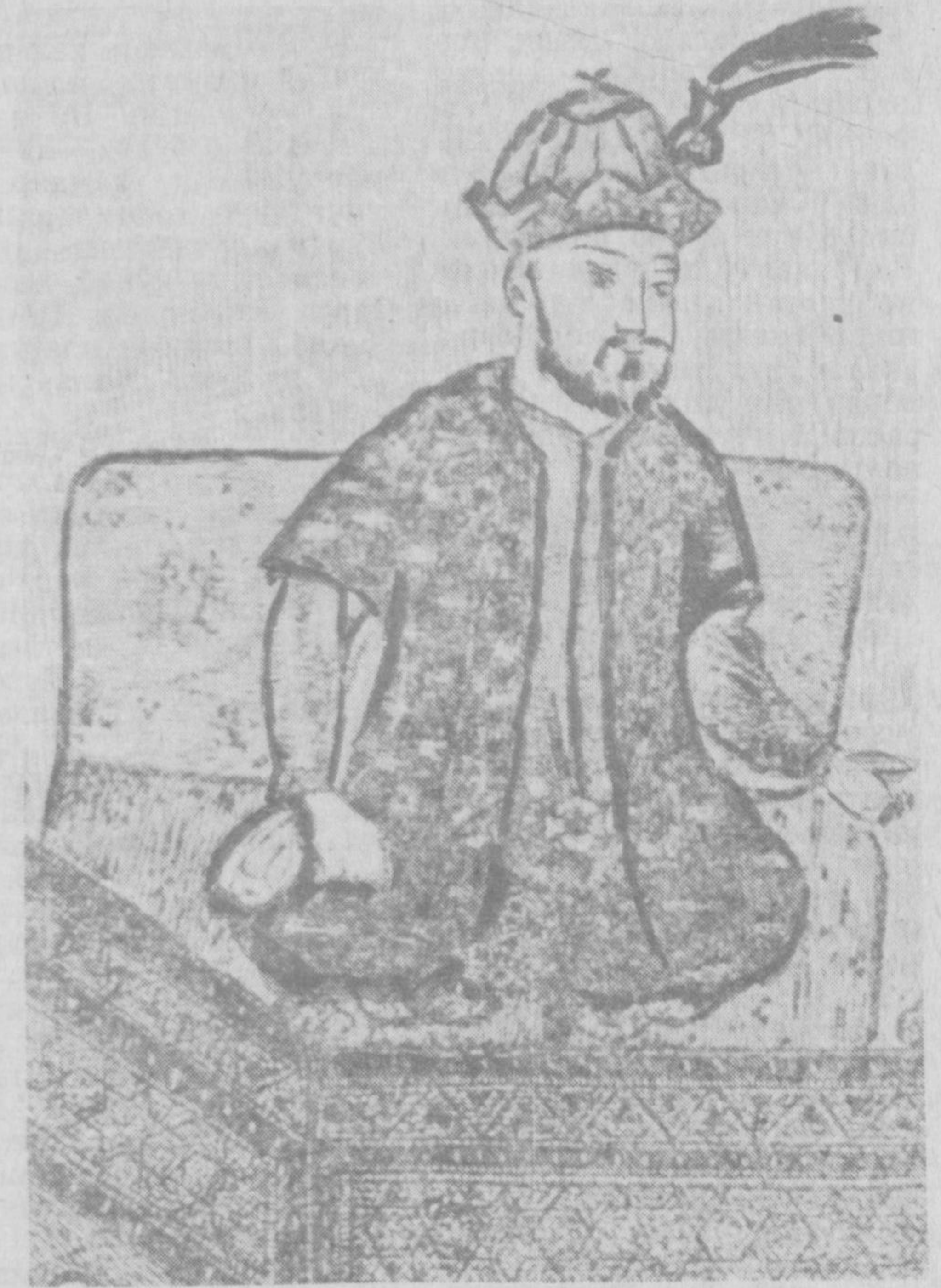
Мирзо Улугбек. [1917 йилда Вашингтонда чоп этилган китобдан олинган сурат].

Мирзо Улугбек асарида бошқа тарихий манбаларда учрамайдиган маълумотлар топиш мумкин. Масалан, «Ўзбек» сўзи авлиё Занги Ота номи билан боғлиқлигини биз Мирзо Улугбекнинг «Тўрт улус тарихи» асарида билдиб оламиз.