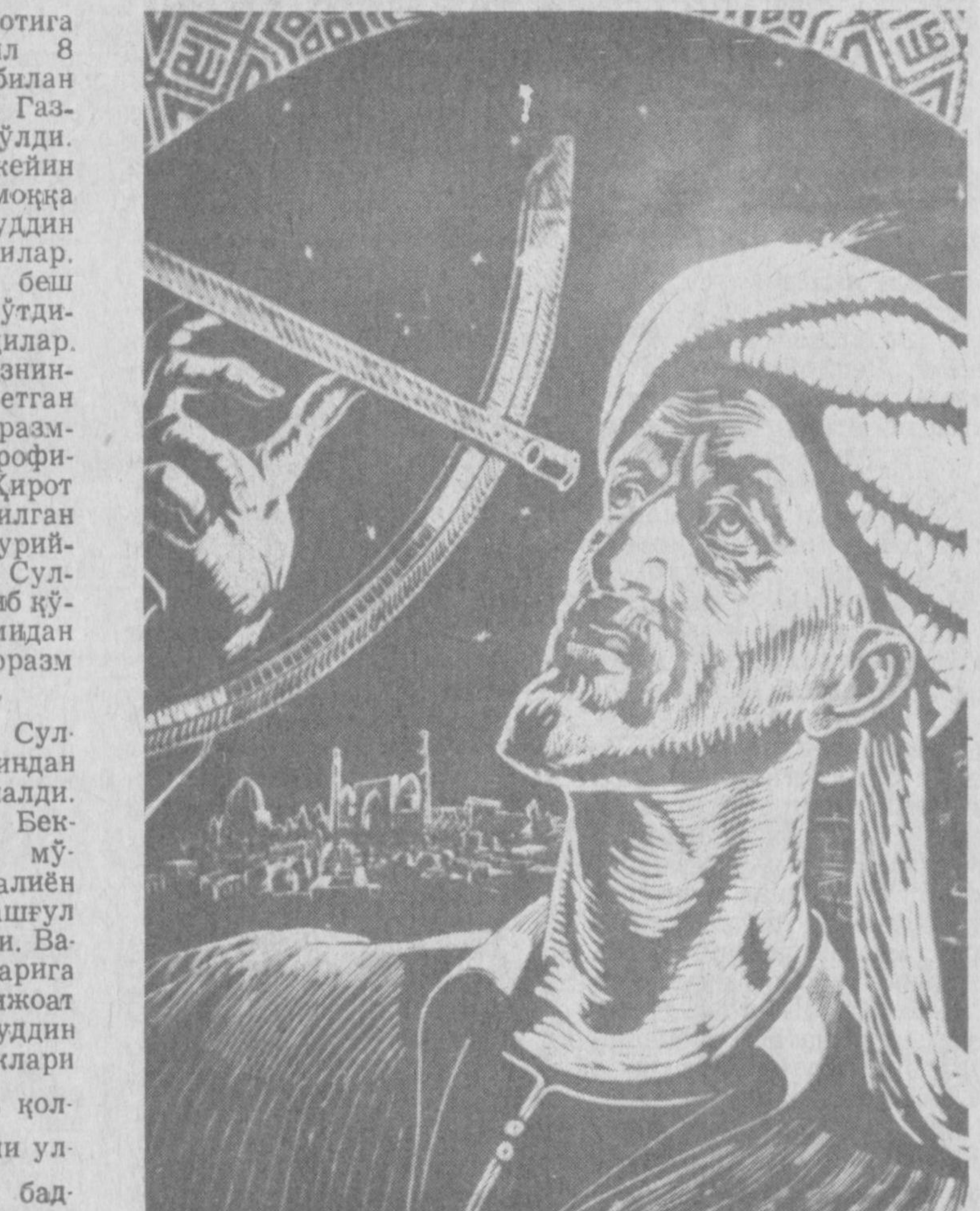
Мирзо Улугбек. С. Редкин гравюраси.

Султон Рукниддин туркий қўй йилга мувофиқ 1222 йилга қадар бандликда бўлди. Мазкур йилда ўзига тааллуқли барча одамлари билан бирга шаҳодат даражасига етказилди.