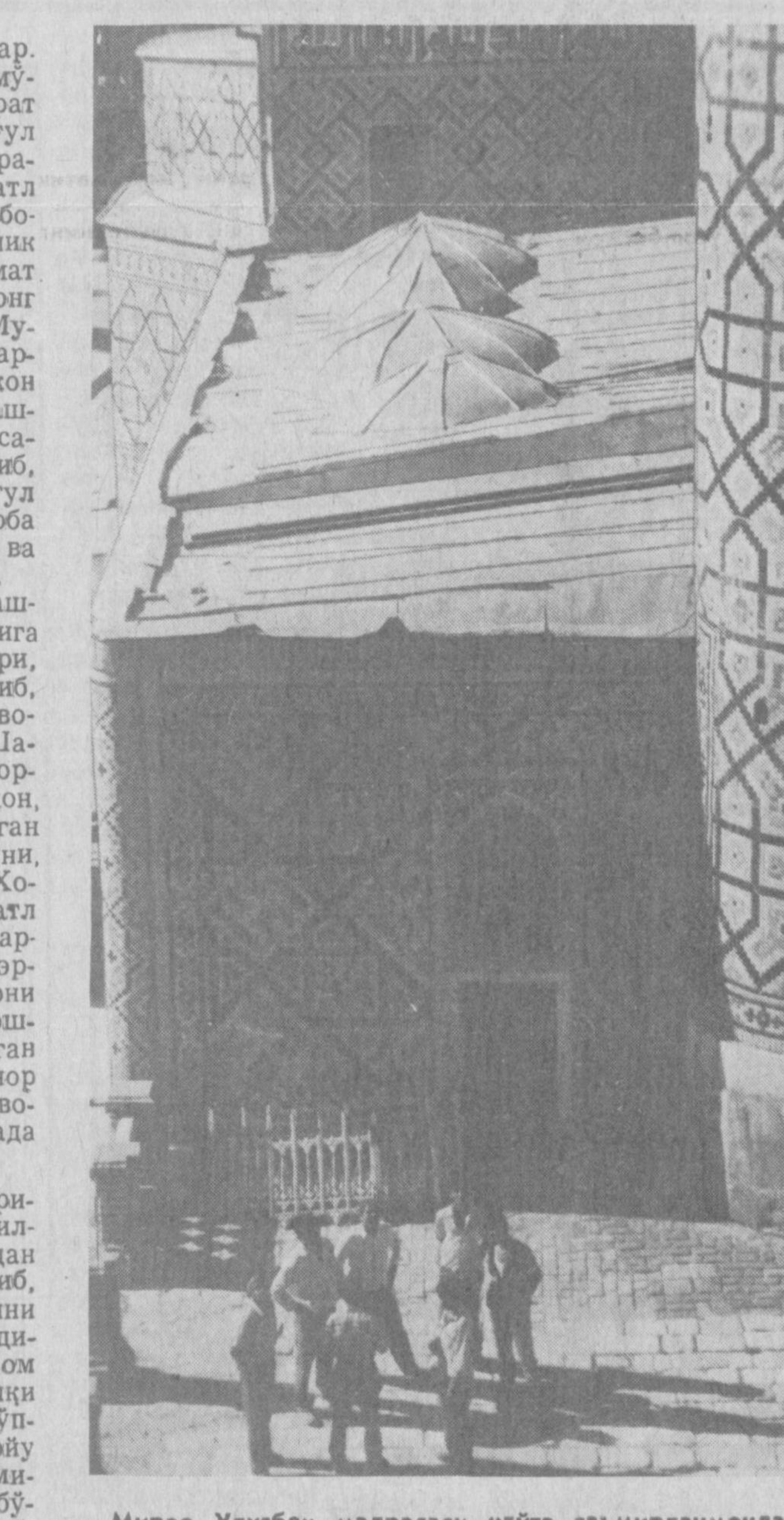
Мирзо Улугбек мадрасаси қайта таъмирланмоқда.

моқчи бўлган эдилар. Бир зарб билан занжирни икки бўлак қилдилар. Белгиланган жойга, саҳрога етганларидан ўз кемаларини сохилга жин суриб, дарёдан чиқдилар.