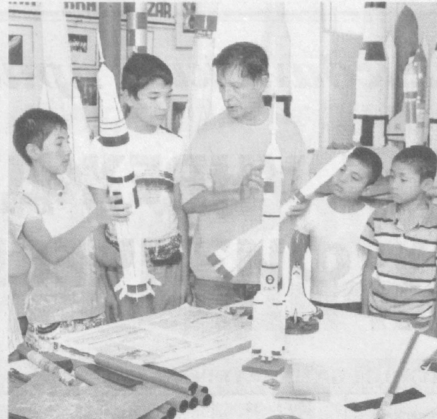
Проявлять свои творческие таланты наши дети имеют возможность с раннего возраста.