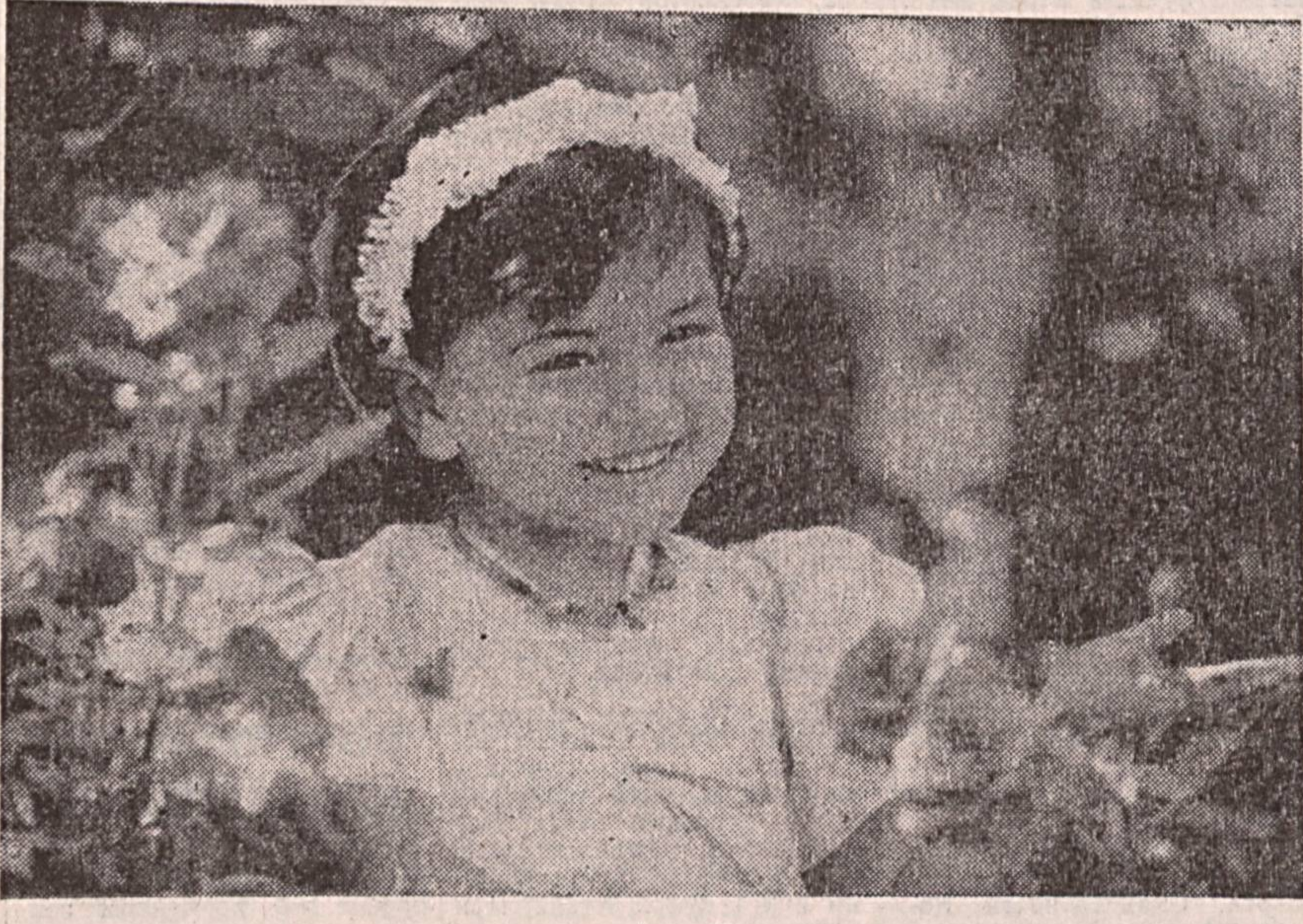
Гуллар яра ўзинг гулсан бетимсол, Кўноқ чехранг дунёга татир бу чоғ. Келажакда сенга янгиликлар иқбол, Озод элиниг эрқотики қизилор, К. ТУРАЕВ олган сурат.