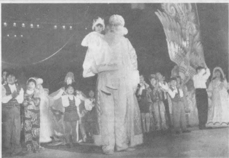
Каникулы — веселая пора

Стали ребята участниками и большого красочного представления, организованного