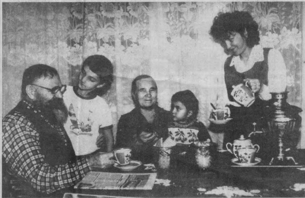
Лад в семье — мир в доме.

Ребенок должен вызывать у родителей радость, от этого во многом зависит, какой личностью впоследствии станет ваш малыш.