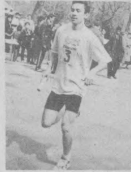
пришедши в Узбекистан Навруз — это праздник весны, красоты, добрых дел.