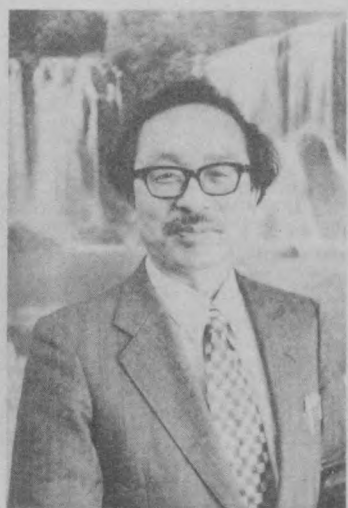
Господин Судо, а каковы ваши личные впечатления о Ташкенте, его людях?