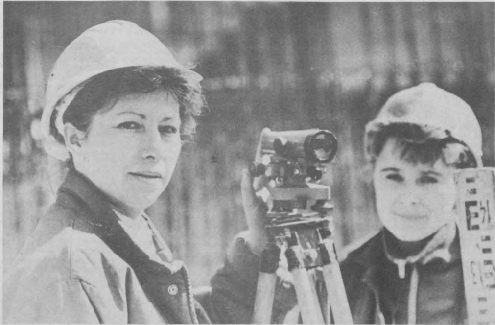
Ташкентское метро: вчера, сегодня, завтра