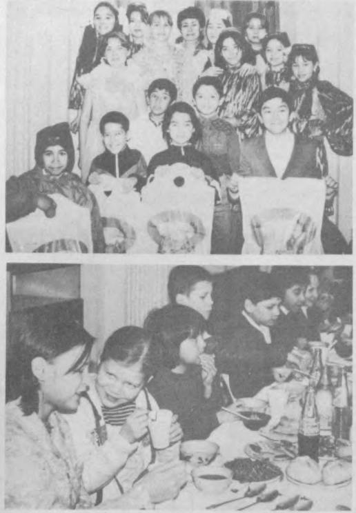
Соб. инф. Фото Рашида ГАЛИЕВА.

Наврүз — праздник особый, и его с большим удовольствием встречают все, а особенно любят дети. Угощения, веселье, подарки, гости. Особенность Наврүза еще и в том, что это праздник милосердия и доброты. И Яккасарайский хокимият, фонд «Наврүз» в Республиканском международном культурном центре организовали праздник для детей-сирот, ребят из малообеспеченных семей.