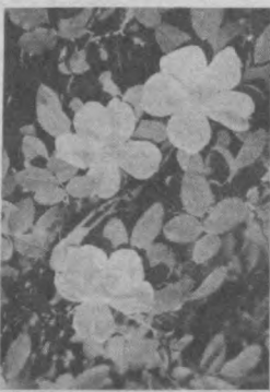
Плоды шиповника содержат витамины С, А, В, Р и К, сахара, пектиновые и крахмальные вещества, железо, медь, марганец, цинк и ряд других высокоактивных веществ. Даже в листьях и лепестках шиповника содержится витамин С. Целятся шиповники и за розовое масло, в состав которого входит более 70 различных органических соединений. Масло получают из лепестков (из 1 кг около 2-3 г). Плоды и лепестки шиповника употребляются в пищу. Цветки его являются хорошим медоносом. Живут все виды шиповника до 25-30 лет. В декоративном садоводстве Ташкента — это желанная культура для украшения города. Используются в одиночных и групповых посадках, для живых изгородей и бордюров, в качестве плодового растения. Широко применяется шиповник в медицине. Настой из его плодов, являясь поливитаминным средством, врачи назначают при лечении неврозов, астении, при малокровии, нарушении обмена веществ, при сахарном диабете, гипертонической болезни и атеросклерозе. Кроме того, шиповник повышает сопротивляемость организма к инфекционным и простудным заболеваниям. Шиповник показан при язвенно-геморроидальных ранах, способствует ускорению сращения костей при переломах. Сироп из сушеного водного экстракта плодов с сахаром под названием «Холосас» применяют при лечении гепатитов и холециститов.

Одним из распространенных видов кустарников, широко используемых в озеленении Ташкента, является шиповник. Он содержит около 400 видов и разновидностей, произрастающих в Северном полушарии. В СНГ растут более 60 видов. Шиповник является родоначальником многих сортов роз. Его считают предвестником лета, так как он зацветает с окончанием весны. Цветки диаметром до 5 см с прекрасным тонким ароматом, белой, розовой, желтой, красной окраской появляются на тонких изогнутых ветвях кустарника. Вечером цветки закрываются, а ранним утром вновь раскрываются в лепестки.