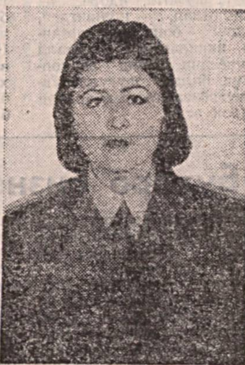
топириқни тез ҳамда сифатли бажаришини айтди.