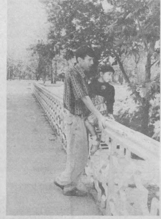
На прогулке с папой.