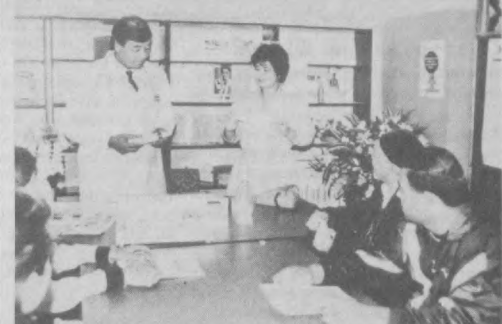
«Ежегодно летом в один и тот же месяц у меня появляется заложенность носа, зуд в глотке, слуховых проходах...»