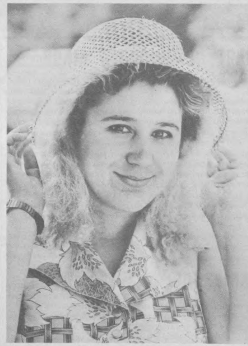
Ташкент и ташкентцы.