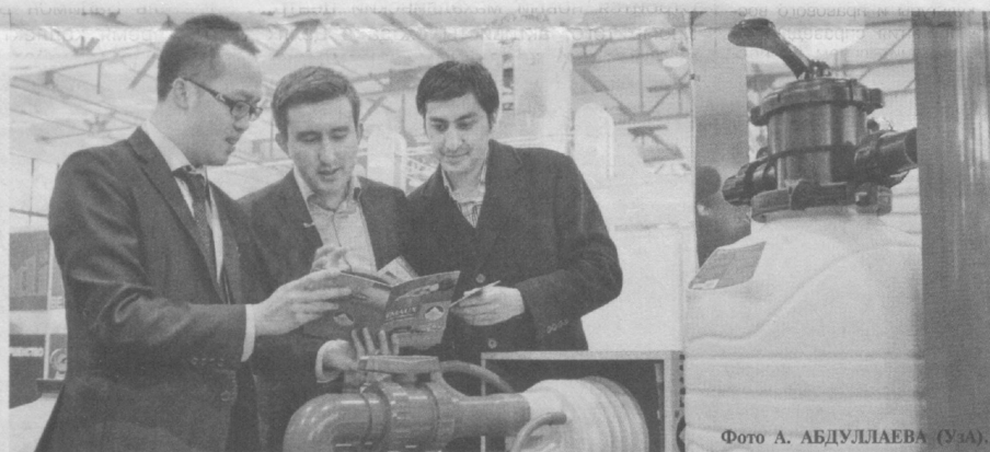
Неуклонно расширяется ассортимент экспортируемой продукции, производимой на отечественных предприятиях.