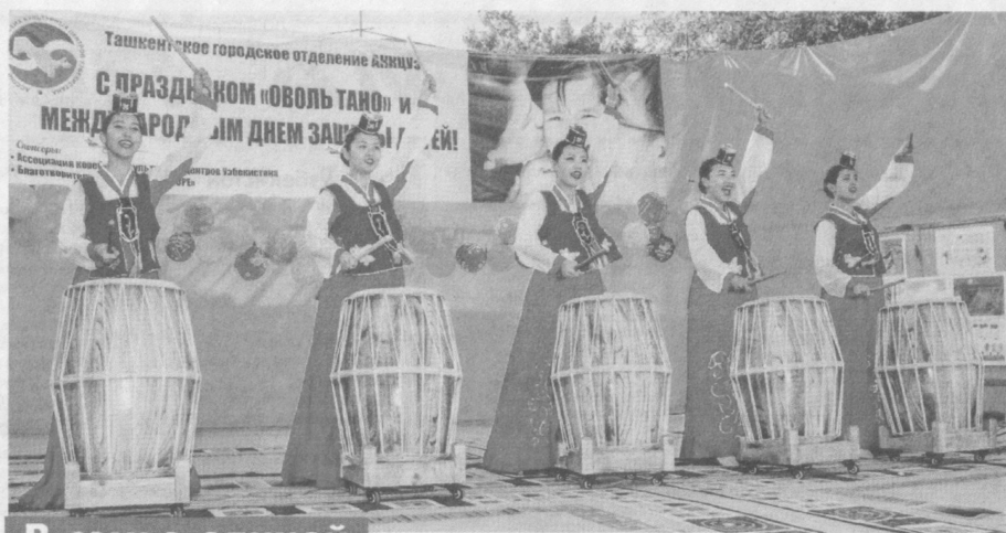
В семье единой

тельных школ, колледжей и лицеев, студенты вузов пришли в этом году широко отметить очередную дату, связанную с именем выдающегося поэта, писателя и драматурга Александра Пушкина. Это — всегда большой праздник, организуемый Русским культурным центром для всех ценителей и почитателей его таланта. Эта общественная организация, имеющая в своем составе 23 территориальных подразделения, существует с 1994 года. На протяжении всех этих лет ее представители ежегодно приходят к памятнику Пушкину, уже давно ставшему классиком миро-