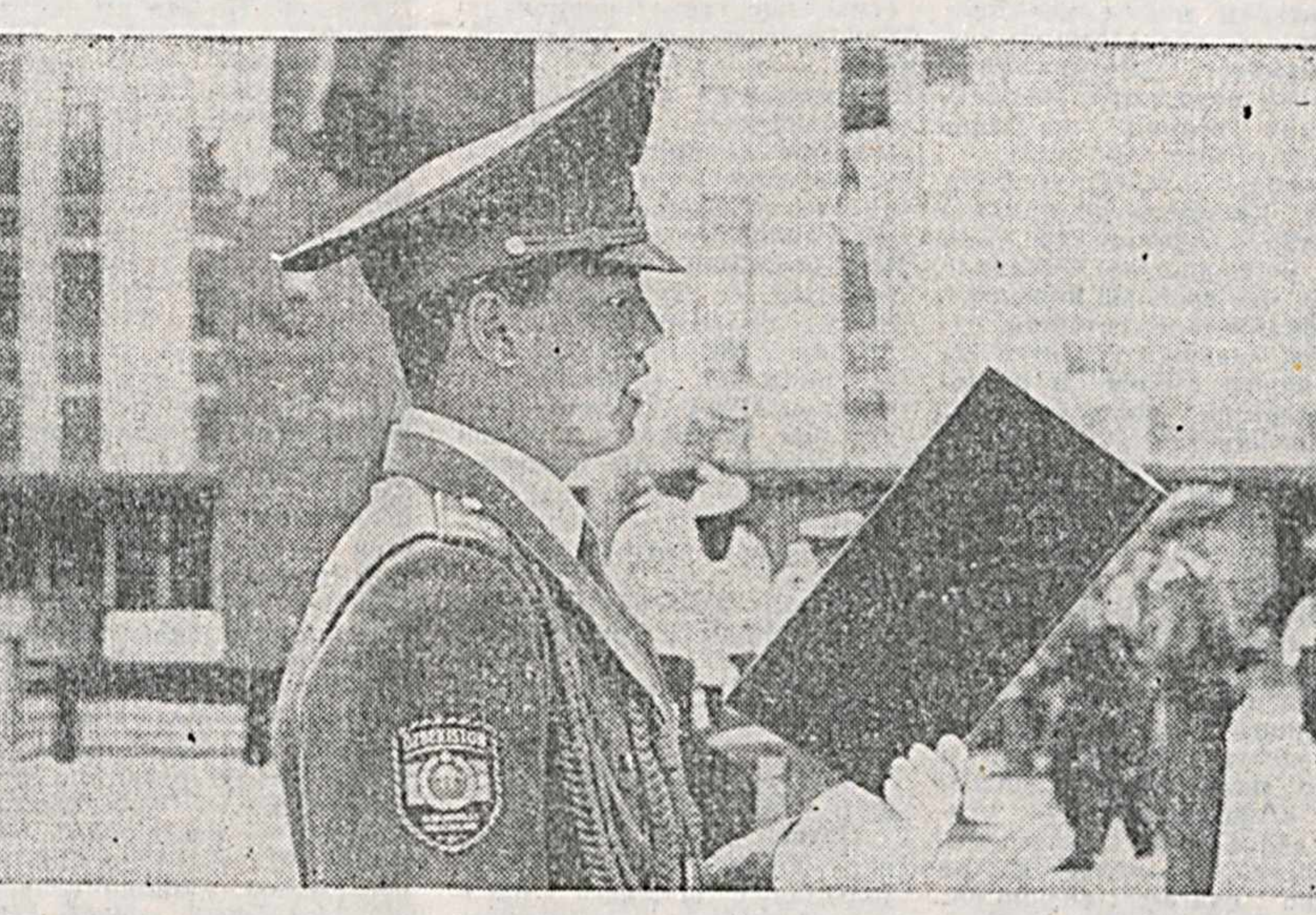
Минувшее воскресенье для всего личного состава Национальной гвардии было днем праздничным. В этот день

во о готовности солдат-новичков к торжественному приему Военной присяги, командир части обратился к сослуживцам с кратким приветственным словом. Посредством приказа присутствующих в принятии Военной присяги.