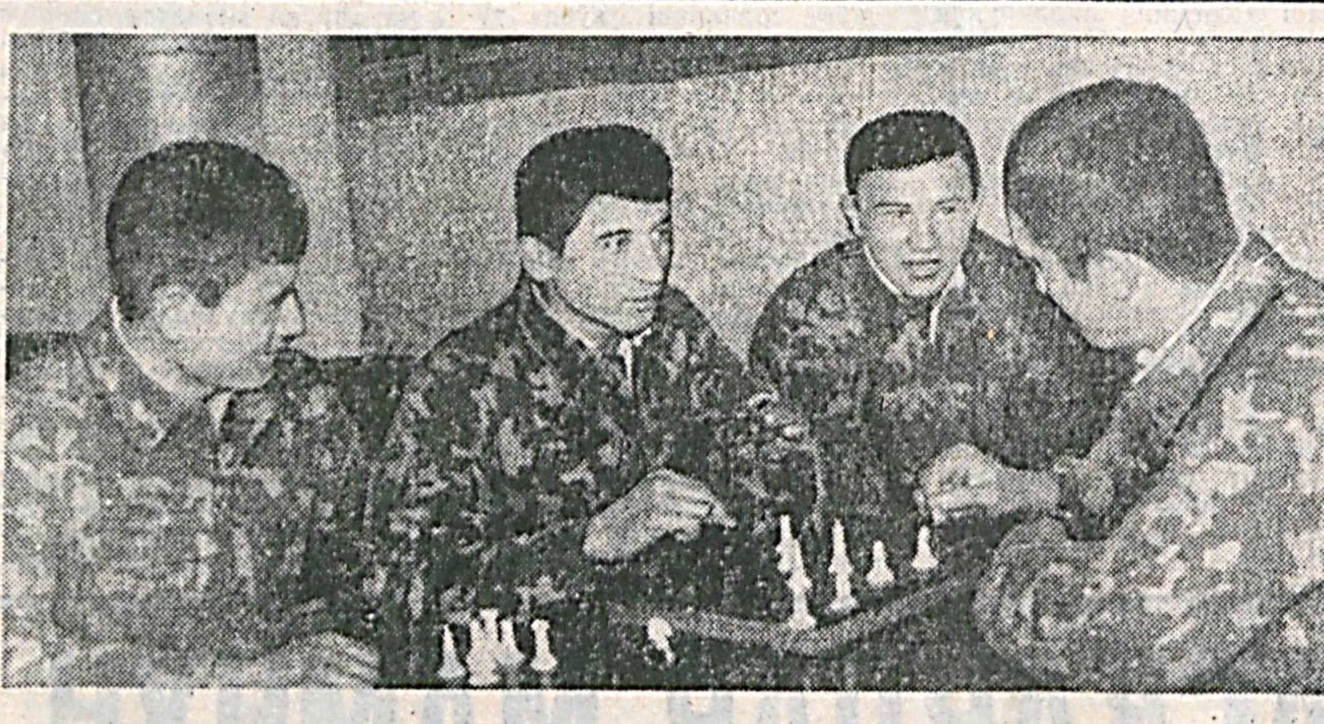
«Яхши дам — меҳнатга ҳамдам» деганлардек, дам олин соғаларида кўнглиди ҳордиқ чўқаришга нима етсин. Аскарлар ҳам бундай оилардан уюмлик фойдаланишга харажат қилишди, албатта. Кимдир китоб мутолаа қилса, кимдир ақиларига хат

Сайёрамизда олти миллиарддан зиёд киши яшайди. Аммо ҳар бешинчи одам тоза ичимлик сувдан фойдаланиш имкониятига эга эмас. Дунё нуфусининг учдан бири қисми эса санитария талабларига мутолақ янаво берилмайдиган шартда яшайди. Статистика маълумотларига қараганда, йилга 3 миллион киши яроқсиз ичимлик сув истеъмол қилиш оғирлигида ортурилган касалликлар туғайди ҳаётдан кўз юмар экан. Гарб давлатлари билан ривожланган мамлакатлар аҳолисининг тоза сувдан фойдаланиш имкониятини олдиргани фақат ҳам жуда катта. Бу маълумотлар ҳақида мулоҳаза юритган киши тоза ичимлик сув масаласи нақадар долзарб муаммога айланганини аниқлаш қийин эмас. Бирлашган Миллатлар Ташкилотининг 2003 йилда Халқаро чучук сув йили, деб эълон қилиши ҳам мавжуд муаммога ечим топиш йўлига интилизлардан биридир. ВМТнинг 2000 йилги Мингиллик саммитида аъзо давлатлар раҳбарлари 2015 йилга дунё бўйига тоза ичимлик сувини қилинаётган аҳолининг тенг ярмини охирига қадар таъминлаш тўғрисида қарор қабул қилган. Бажарор тараққиёт мавзуси баёнланган Ноханбесуғ саммитида эса шу муудат ичда ақсилсантар холда кун кўраётган одамларнинг намида 50 фоизга қўлай шартот яратиб беришга келишиб олинди.