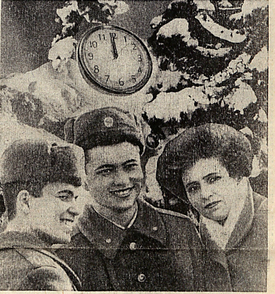
Гам-ташвишлар бизга ёт бу кун. Ўзбек халқи гоёт шод бу кун. Гуллаб-яшнаб барча маҳалла, маҳалла, баралла! Хизматимиз кетмас беҳуда, Тинчлик учун жонимизни фидо. Орда қолдик айтинг-чи кимдан, Нам эмасмиз бизлар ҳеч кимдан. Ҳарбийларнинг бари аёл қомат, Янги йилда кулар зур омад, Тафаккур ва билимдодир куч, Тинчлик бизга фарқ этмағай ҳеч, Оқил одам иш-иш қўриқчисин, Аёл йилги юрт қўриқчисин! Янги кунлар бизни кутлағай, Нам-қўстимиз алобат бўлгангай, Инсонлар табарруқ, улуг, Тупроғи зар, ҳосилга тўлиқ, Азиз юртим, жонон оғлим, Дармик, янги йил бўлсин кутлуг!

ўрни эгаллаши — буларнинг барчаси келгуси йилларда ҳам бизнинг асосий мақсад-муддояларимиз бўлиб қолиши шубҳасиз. Мухтасар қилиб айтганда, яқинга етаётган йилда Ватаннинг дунёда обрў-эътибори, нуфузини янада ошириш борасида, ички ва ташқи сиёсатда, барча соҳаларда қўлга киритган марраларимиз билан ҳар қанча фахрлансак, гурурлансак арзийди, албатта.