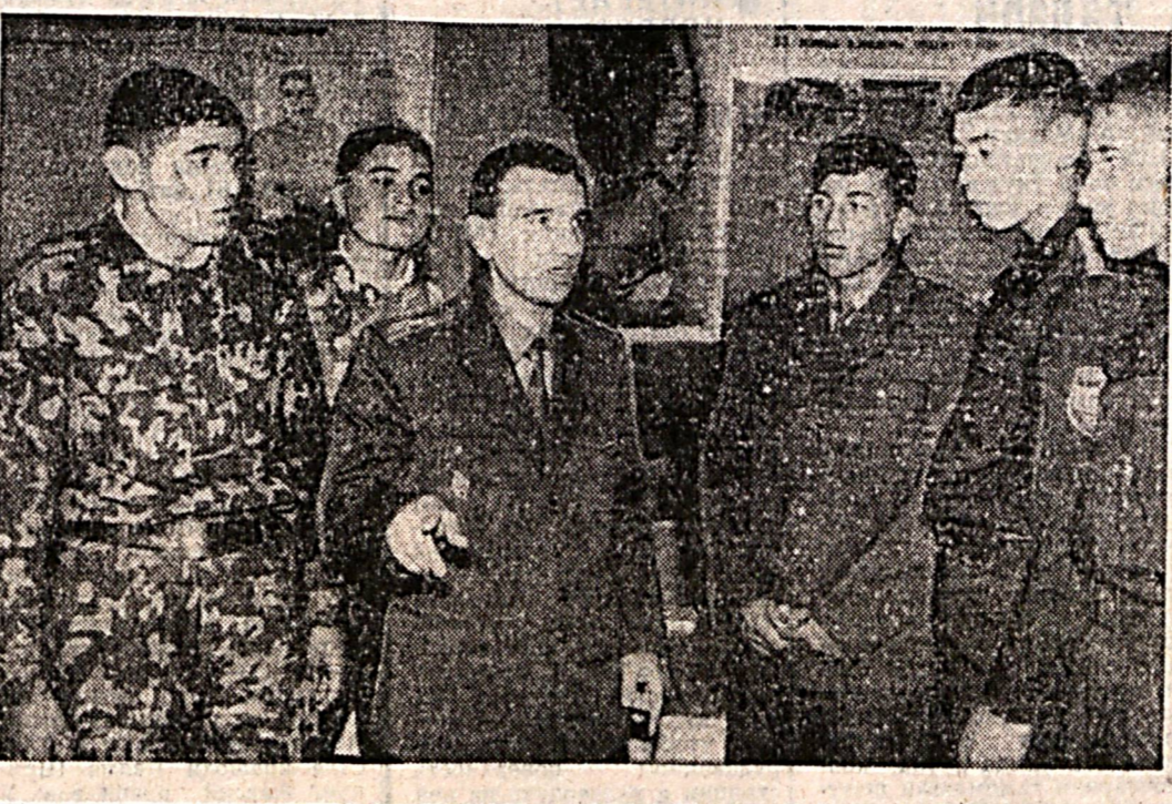
Самарқанд гарнизони офицерлар уйда она-орт посбонлари билан учрашув орқали табиғи давом этди...