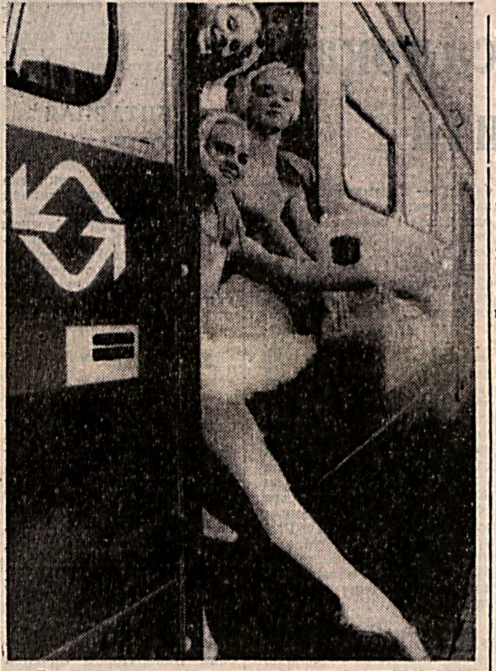
Вот так неожиданность: хотите верить, хотите нет — «Лебединое озеро»... в трамвае.