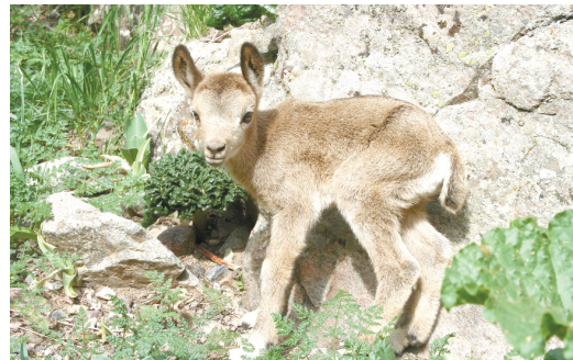
Константин САЙДАЛИЕВ, наш корр.