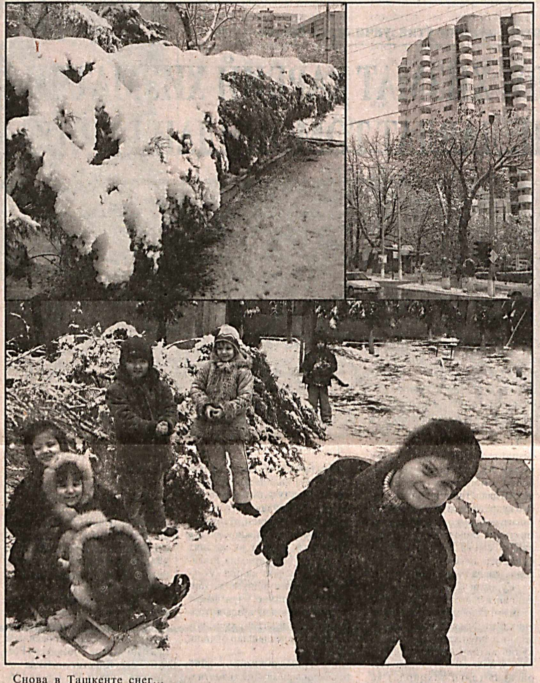
Снова в Ташкенте снег... Фото Александра МРУЧАКА.

Майор Алижон САФАРОВ, «Ватанпарвар» мухбири, Александр МРУЧАК суратга олган.