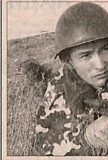
Оммавий ватанпарварлик тadbирлари