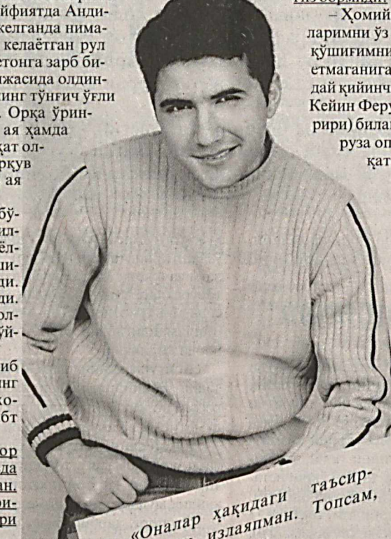
«Оналар ҳақидаги таъсирчан шёр излайдиман. Топсам, қўшиқ қилардим».

Шундай таъсирчан шёрни излаётган, уни топаган заҳоти мен учун қадрили бўлган онажонимга бағишлаб қуймакочиман. Олий оиддан чиққан экансиз, биринчи қўлингизнинг ёшида қисқонили қийинчиликлар бўлмаганми? Ёши ҳомиёларингиз бўрмиди?