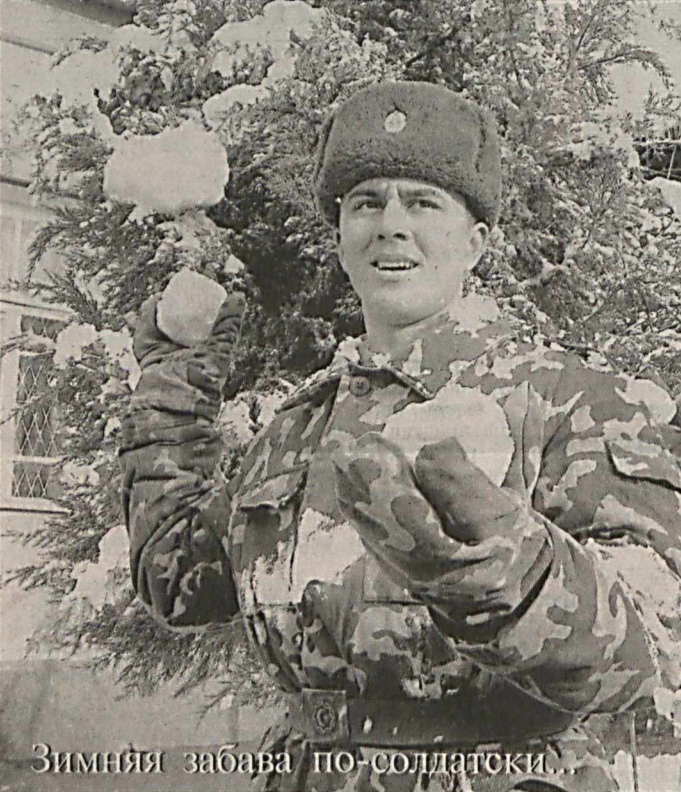
Зимний забави по-солдатски.