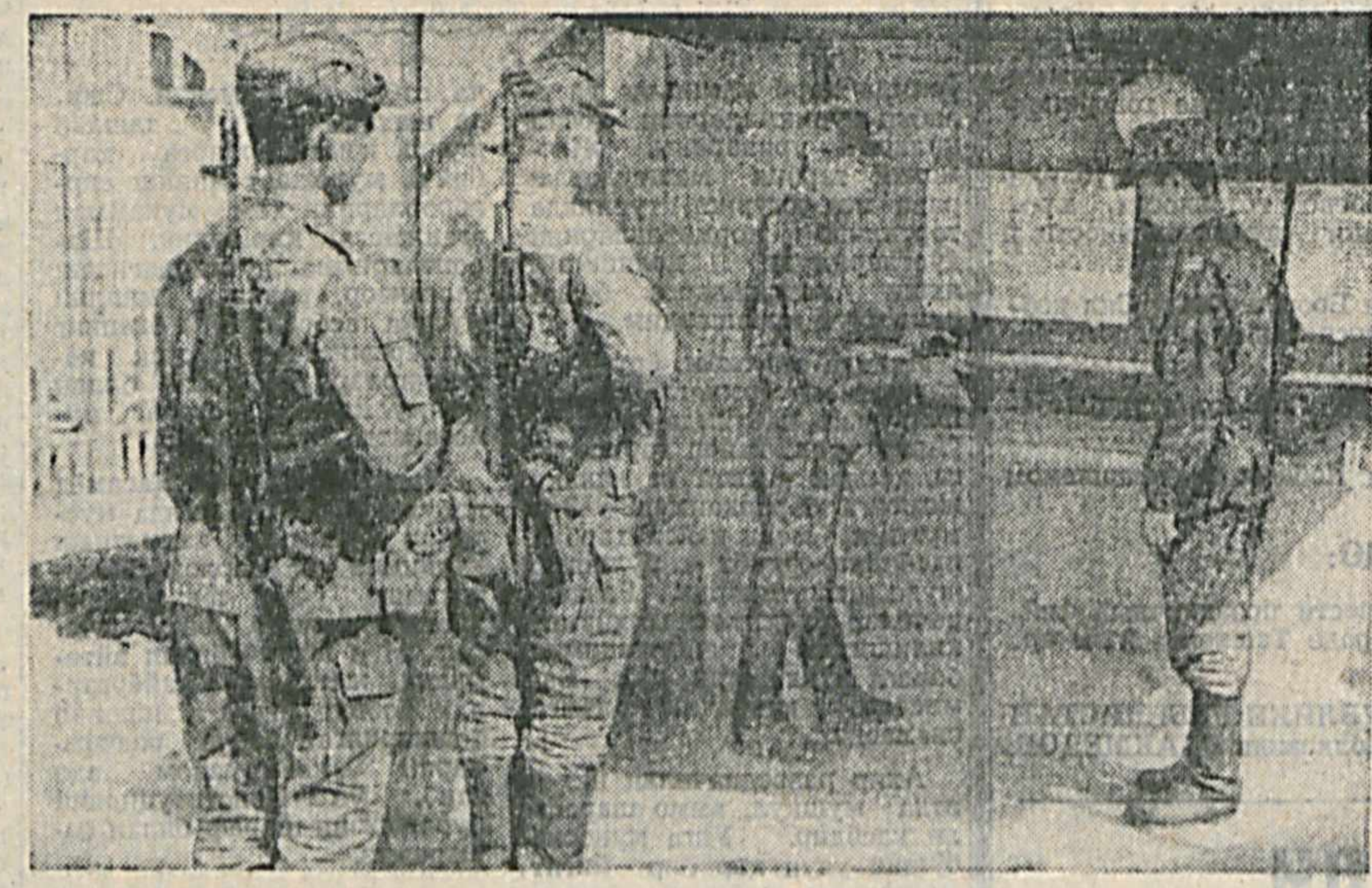
Харбий жамоаларда Узебекистон Республикаси Қуролли Қучдарининг Умумий Низомида кутга ниҳатини ўз ичига олган вақтда, бундан ташқари, бундан ташқари, бундан ташқари...

Конечно, чтобы, напри- мер, сбить и прожечь все масляные и топливные филь- мы, требуется немало тру- да. Но курсанты занимались практической работой с удо- вольствием — ведь это была возможность на практиче- ски проверить, насколько ус-