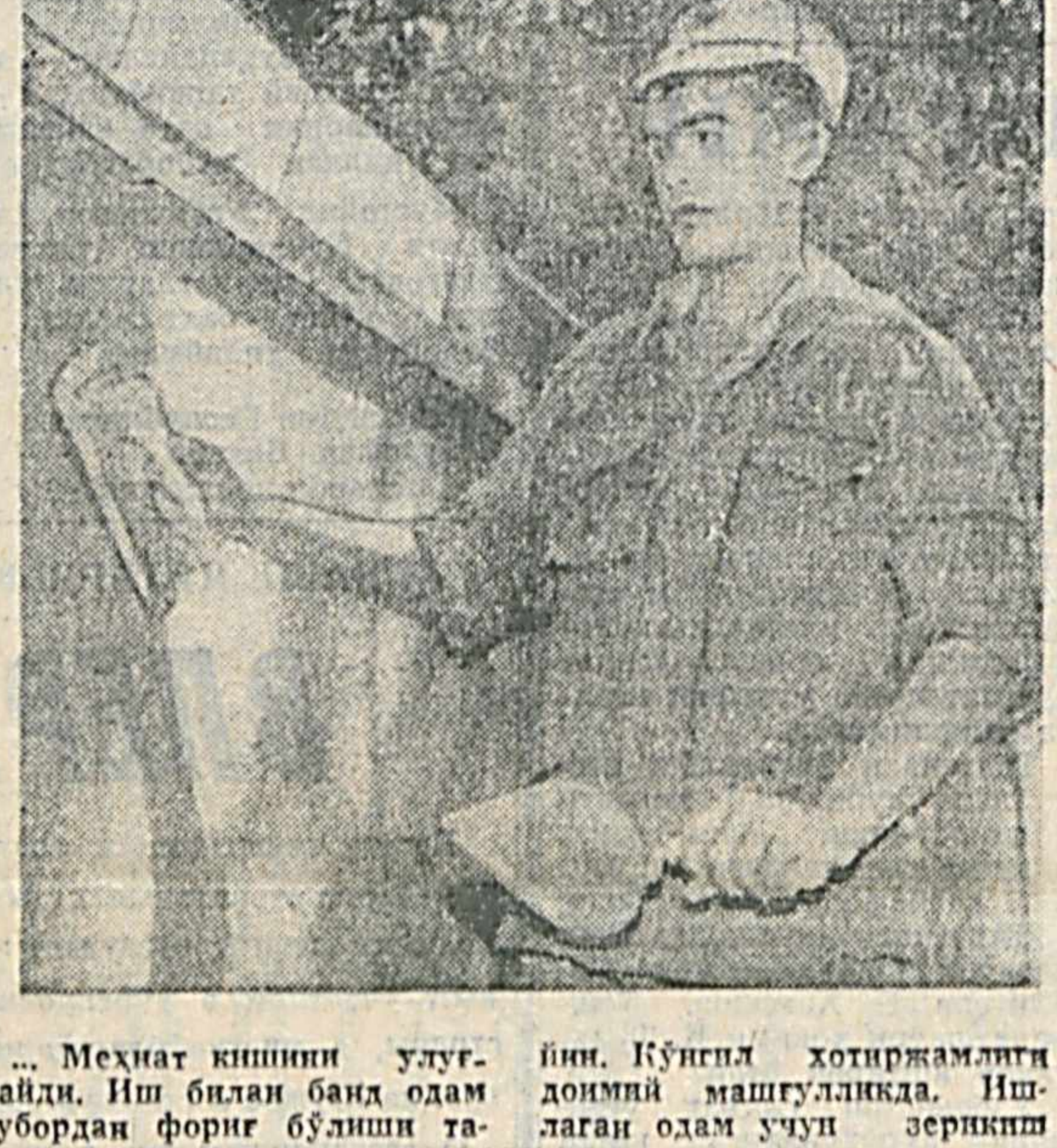
Мехнат киннини улуғлайди. Иш билан банд одам гурбордан хорманг бўлиши та...