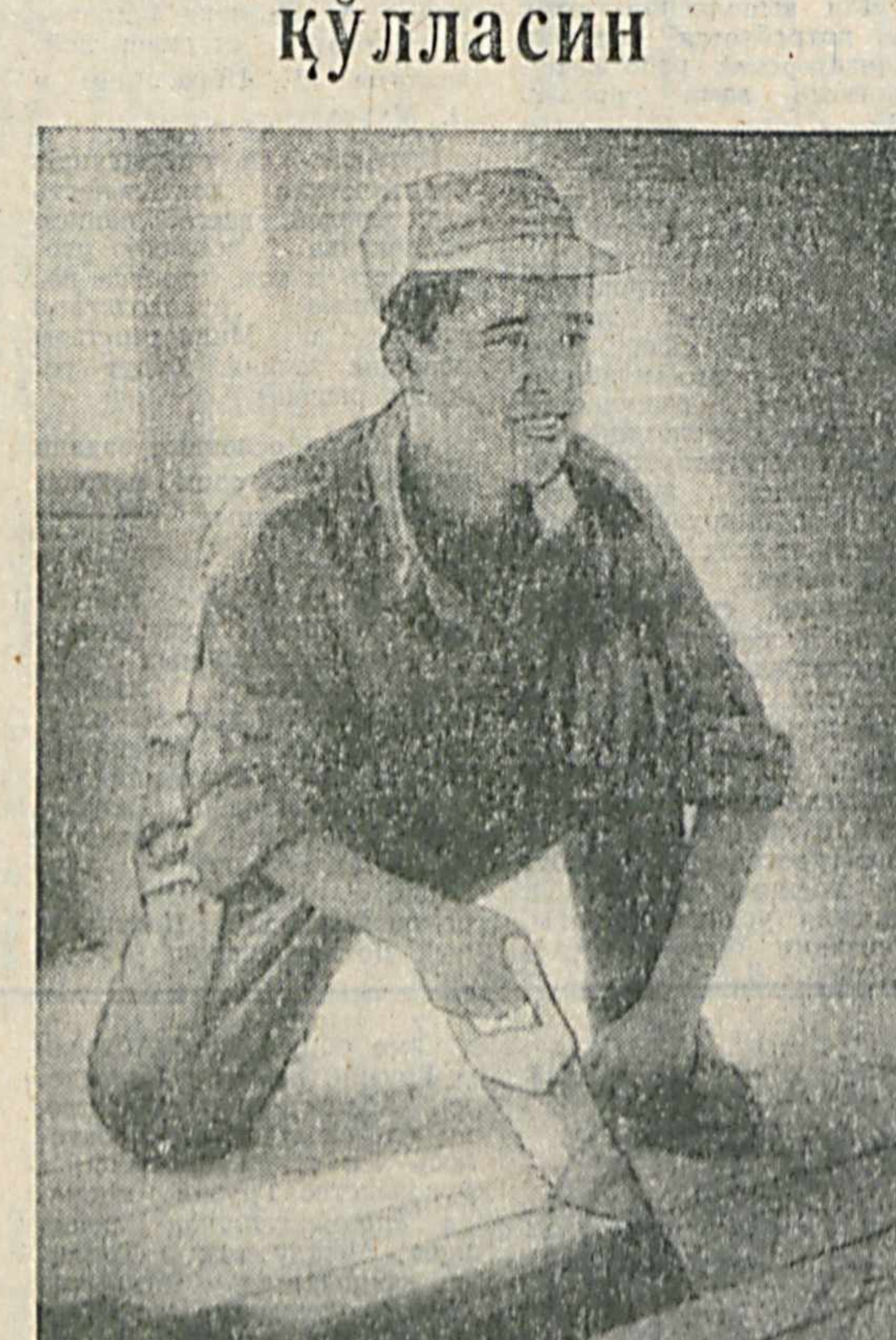
Тарихи минг йилларни қамраб олган она. Ватанимиз — Туркистон заминини ўзининг устолари — дурадгорлар, бозорлар, ганчкору расомлар билан ҳам оламга машҳур. Ўзбекистоннинг тарихий обидларини ҳам халқимиз кишини ҳайратга солади...