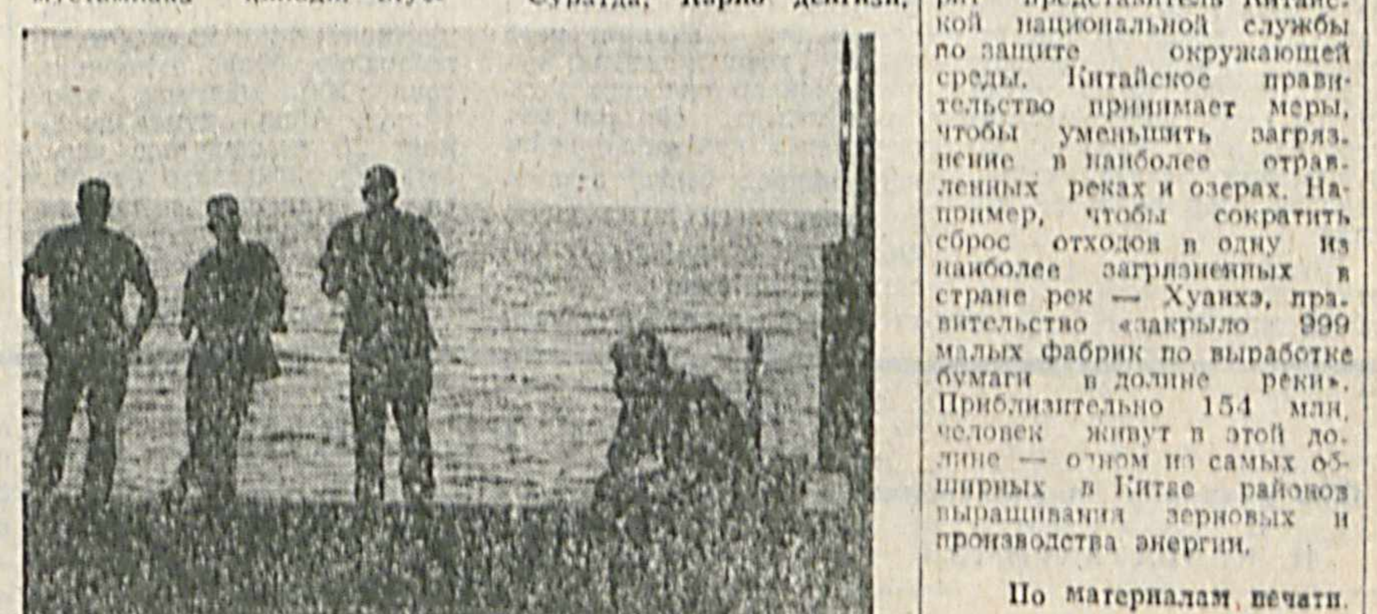
По материалам печати.

ХХР Чанчун шаҳарида қарий ҳаво кучлари учун учувчилар тайёроқини интитутига стувини турмуш 37 кун дабўл қилинди. Уларнинг энг каттасини энг 20 да, энг ёши 17 дадир.