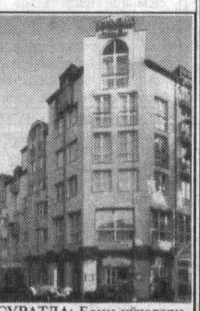
СУРАТДА: Бонн кўчалари.

Улар яқинда Исроилда юз берган портлашга алоқадорликда айбланмоқда. Маълумотларга қараганда, бу портлашга натижада 27 киши ҳаётдан қўз юмган ва 80 киши жароҳатланган. БМТ Бош қотиби Бутрос Галий Исроилда содир этилган ушбу воқеани машаққат билан эришилган тинчлик жараянига нисбатан қўлингн хужум, дея изоҳлади.