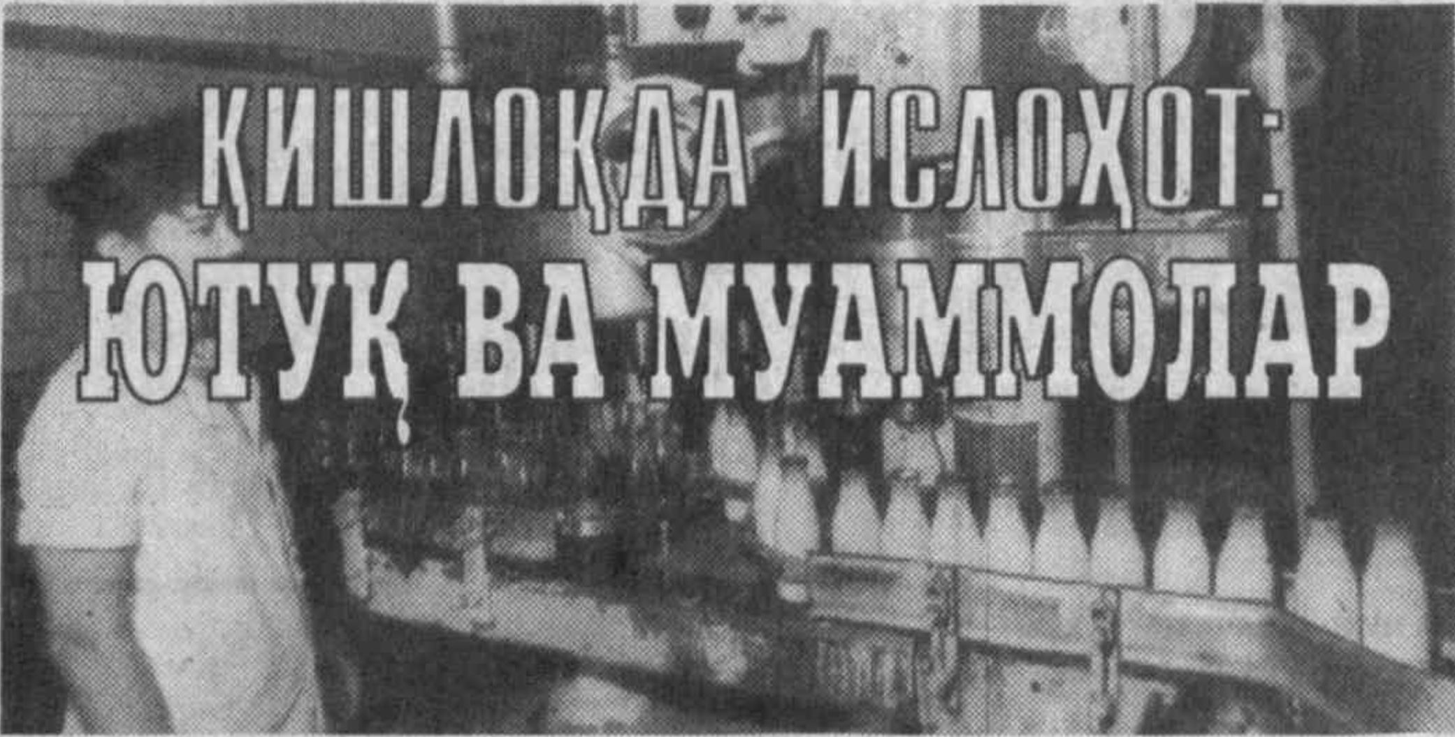
ҚИШЛОҚДА ИСЛОҲОТ: ЮТУҚ ВА МУАММОЛАР

да 3-4 гектар галла ўриб, 5-6 фоиз (экинларида, ҳатто, 10 фоизга) дон нобударчилигига йўл қўяётган бўлиса, «Кейс» да бу қўратилиш бери смнада 40-45 гектар бўлиб, дон нобударчилиги 0,5 фоиздан ошмайди.