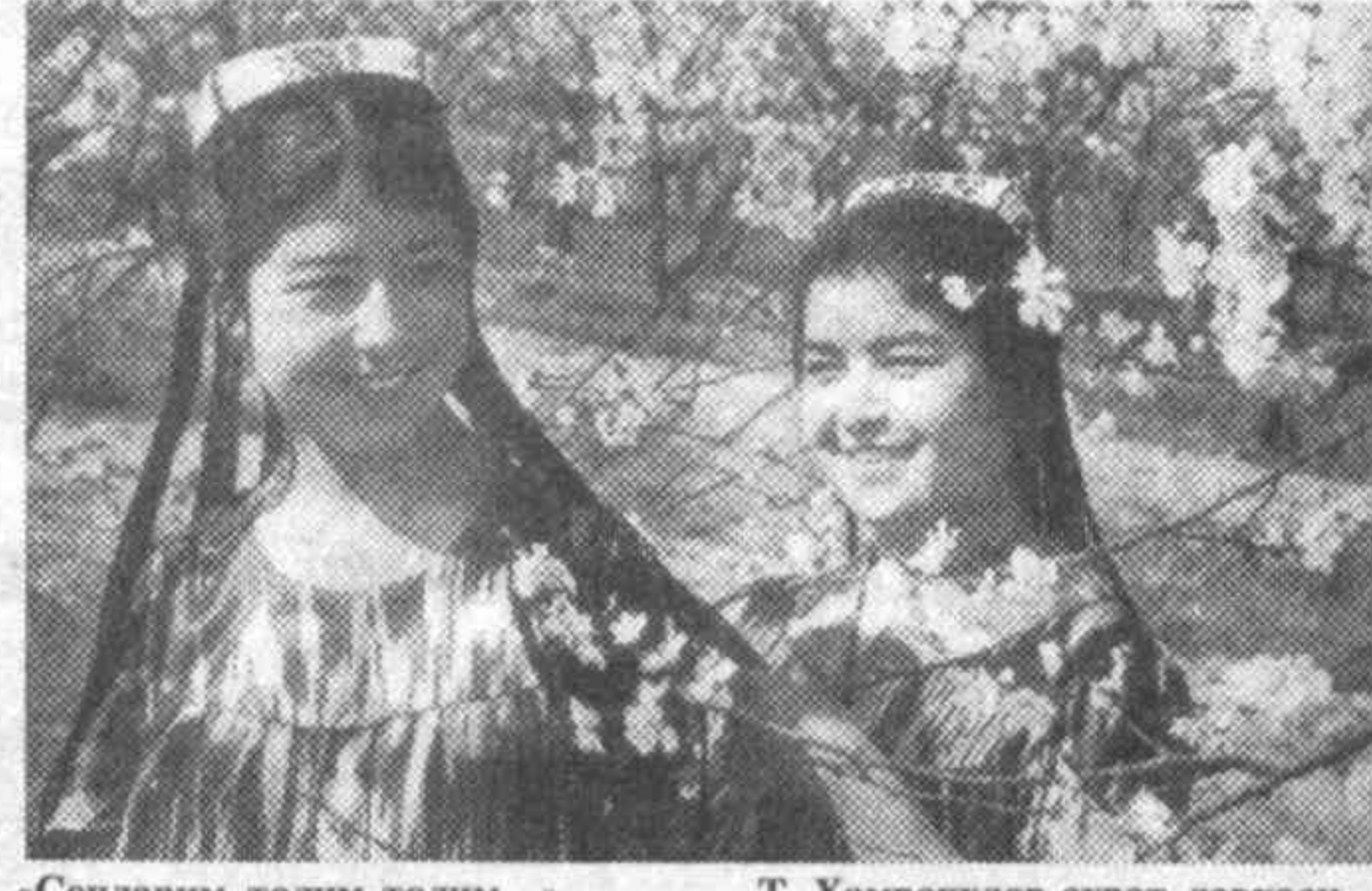
«Соҳларим толим-толим...»