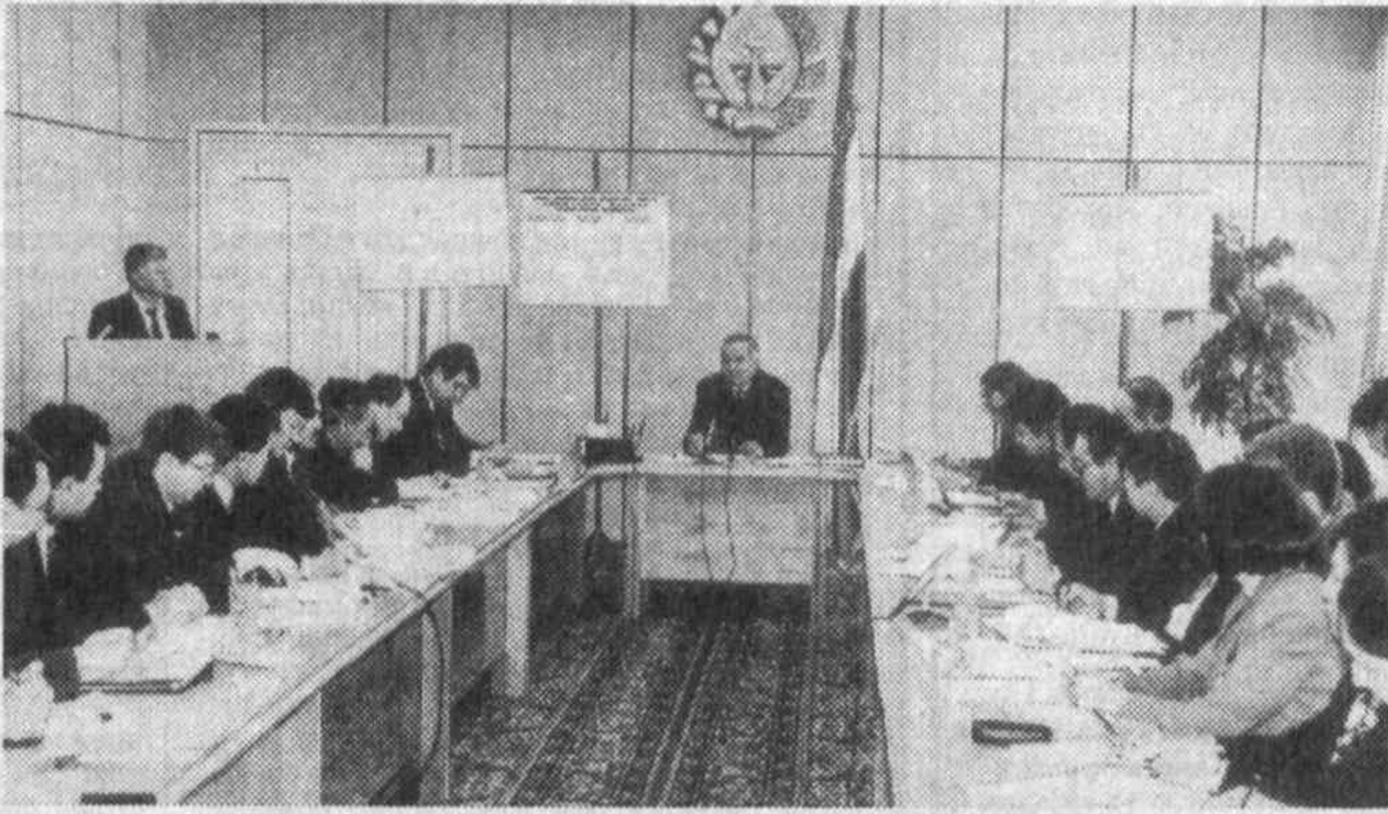
СУРАТДА: мажлис пайти.

Ўзбекистон Республикасининг ташқи ишлар вазири Абдулазиз Комилов 19 март кунин мамлакатимизда меҳмон бўлиб турган Хиндистан Республикасининг ташқи ишлар вазири Прадип Мукерजी билан учрашди. Учрашувда икки мамлакат ўртасида савдо-иқтисодий, маданий ва бошқа соҳаларда ўзаро ҳамкорликни кенгайтириш билан боғлиқ масалалар муҳоказма этилди. Музоқарада, шунингдек, минтақадagi бугунги яқин ҳам муҳоказма қилинди. Унда минтақда тиричилик ва барқарорликни сақлаш борасида кучларни ўзаро бирлаштириш ҳақида фикр билдирилди. (ЎА).