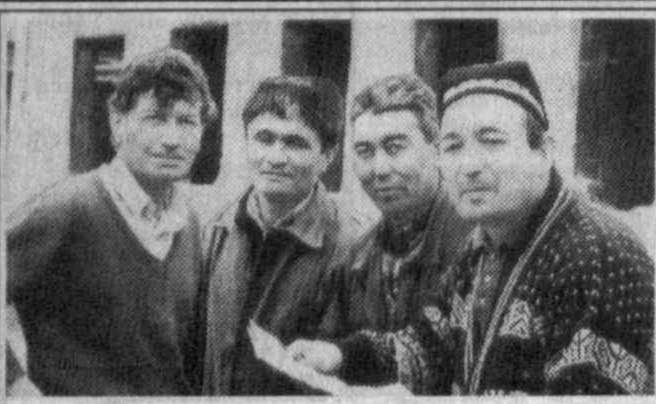
Балиқчи туманида қурилиш ишларида алоҳида эътибор берилмоқда. Шу сабаб туман маркази ва қишлоқлар обод ва кўркамлашмоқда. Айтиш мумкин бўлади, туманда болалар босқичлари, мактаблар қурилиши жадал суръатлар билан олиб борилаётган. Бу ишларни бажаришда тумандаги 109-хўжалиқларро механизациялашган кўча колонна ҳам фолли иштирок этилмоқда.

Китоб билан таништириш маросимида Ўзбекистон Республикаси Президентининг Давлат маслаҳатчиси Вячеслав Голишев, Ўзбекистоннинг Германиядаги Факултода ва Мухтор элчиси Алишер Шайхов ва Ўзбекистон Давлат матбуот қўмитаси раиси Рустам Шугуломов иштирок этдилар.