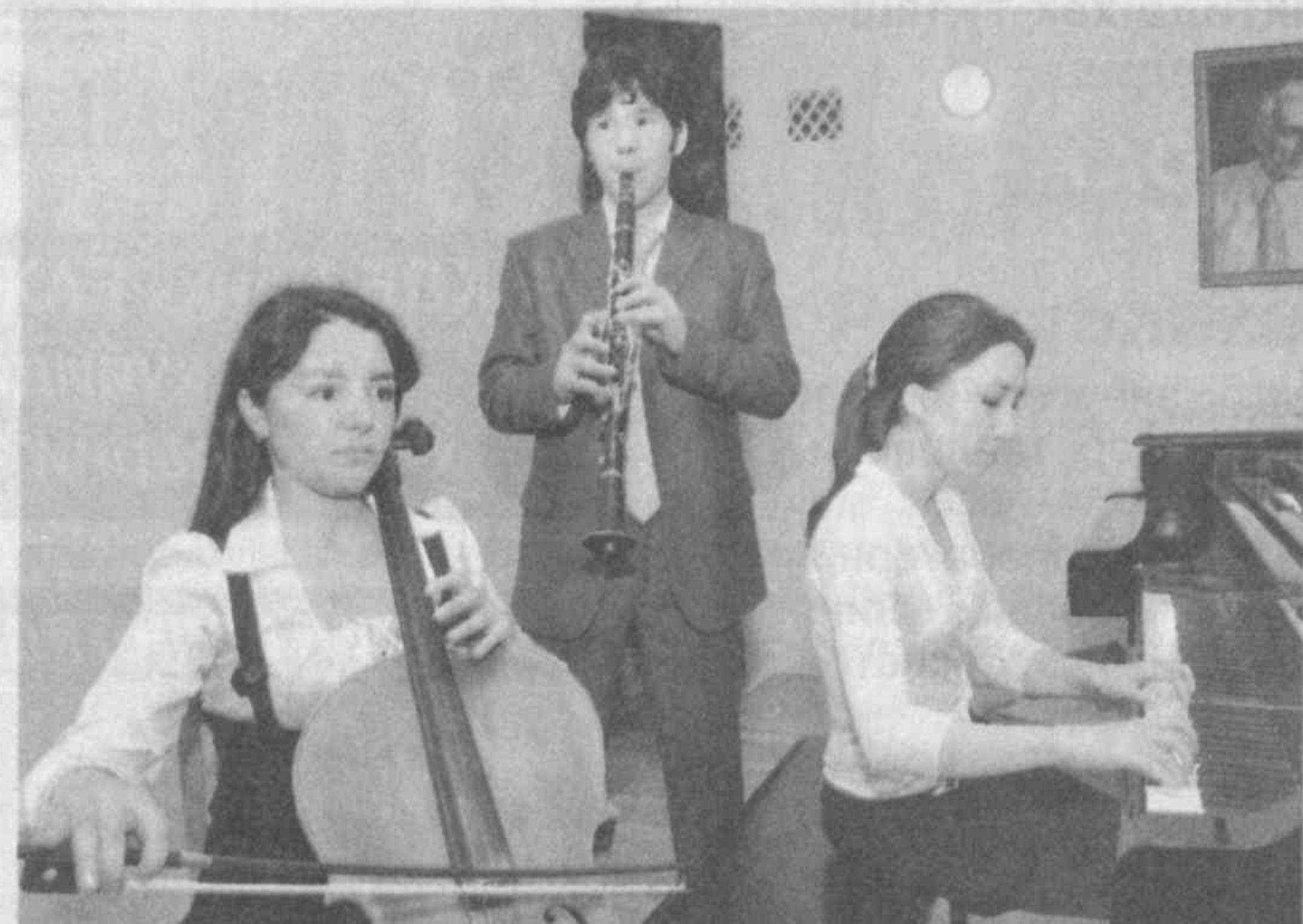
Юртбошимизнинг «Болалар мусиқа ва санъат мактабларининг моддий-техник базасини мустаҳкамлаш ва уларнинг фаолиятини янада яхшилаш бўйича 2009 — 2014 йилларга мўлжалланган Давлат дастури тўғрисида»ги қарори мамлакатимизда ёш авлоднинг мусиқий иқтидорини юксалтириш, ёшлар қалбиде санъатга муҳаббат уйғотишдек эзгу мақсадга ҳамоҳанг эканлиги билан аҳамиятлидир. Мазкур ҳужжатда кўзда тутилган вазифаларга кўра, ёшларимизнинг миллий мусиқа санъатимиз, жаҳон мумтоз мусиқаси ҳамда тасвирий санъатнинг бетақорор намуналаридан кенг

бахраманд бўлиши учун шарт-шароит яратилмоқда. Энг чека кишлоқ ҳудудларида камол топаётган истеъдодли ўғил-қизларни кашф этиш, жойларда бошланғич мусиқий таълим тизимини янада такомиллаштириш бугун биз, ўқитучиларни, қолаверса, бутун санъат аҳлини қувонтириши табиий. Чунки келажакимиз ворислари бўлиши жондан азиз фарзандларимизнинг энг замонавий шарт-шароитлар асосида таълим олиши, жаҳон миқёсидаги нуфузли танловларда истеъдодини намойён этиши ҳар биримизнинг дилмиздаги энг катта орзулардандир.