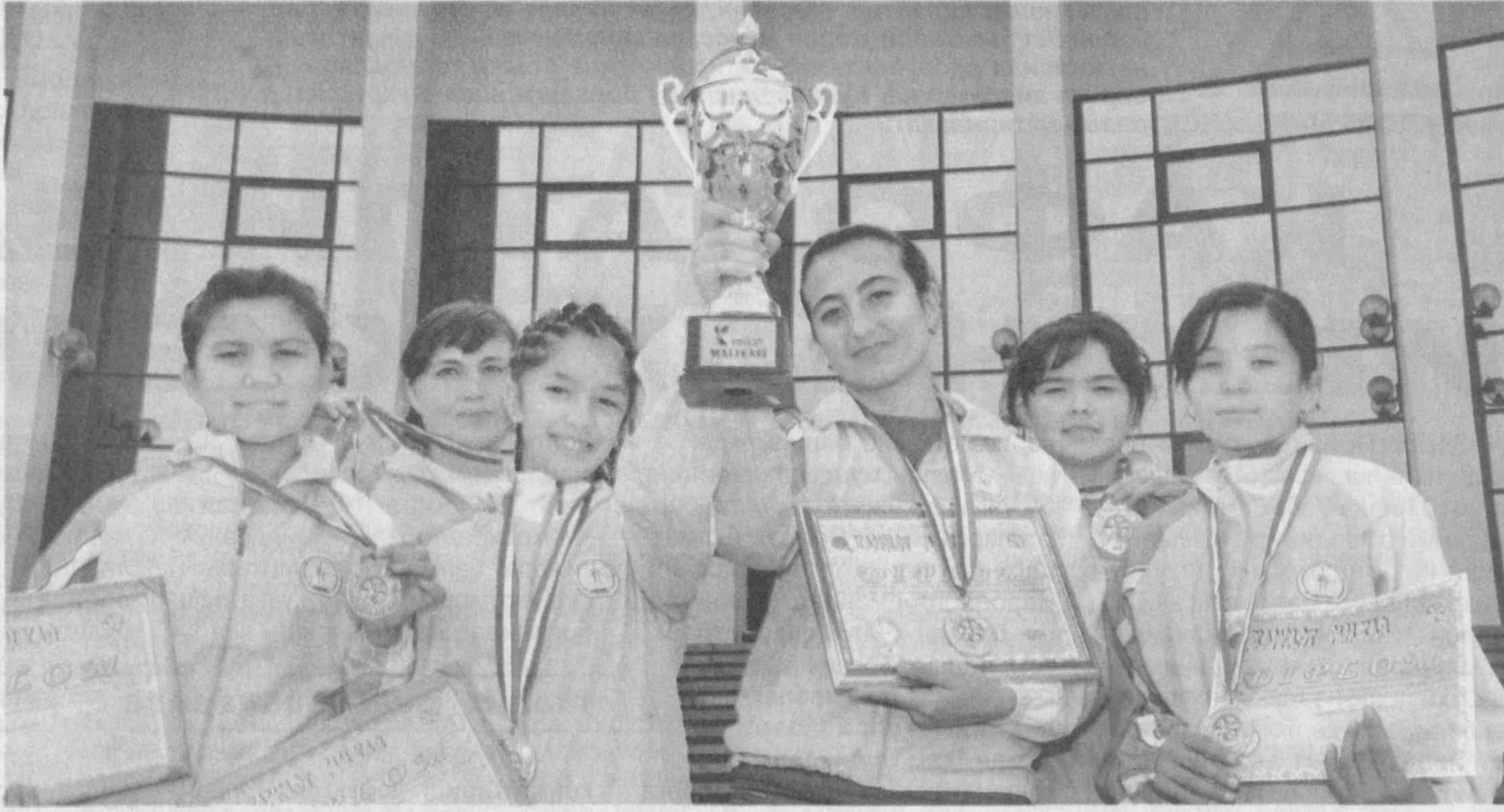
Мамлакатимизда Президентимиз раҳнамолигида эртагимиз эгалари бўлмиш ёш авлодни ҳар томонлама билимли, маънан етук ва жисмонан соғлом қилиб тарбиялашга устувор вазифалардан бири сифатида эътибор қаратилмоқда.

Таъкидлаш жоизки, ушбу мақсадларга эришишда давлатимиз раҳбари ташаббуси билан бундан бир неча йил муқаддам ҳаётга татбиқ қилинган Кадрлар тайёрлаш миллий дастури муҳим аҳамият касб этаётди. Унинг амалдаги самаралари ўларок, юртимиз шаҳару қишлоқларида бири-биридан кўркам, замонавий таълим муассасалари, жумладан, академик лицейлар, касб-хунар коллежлари қад-