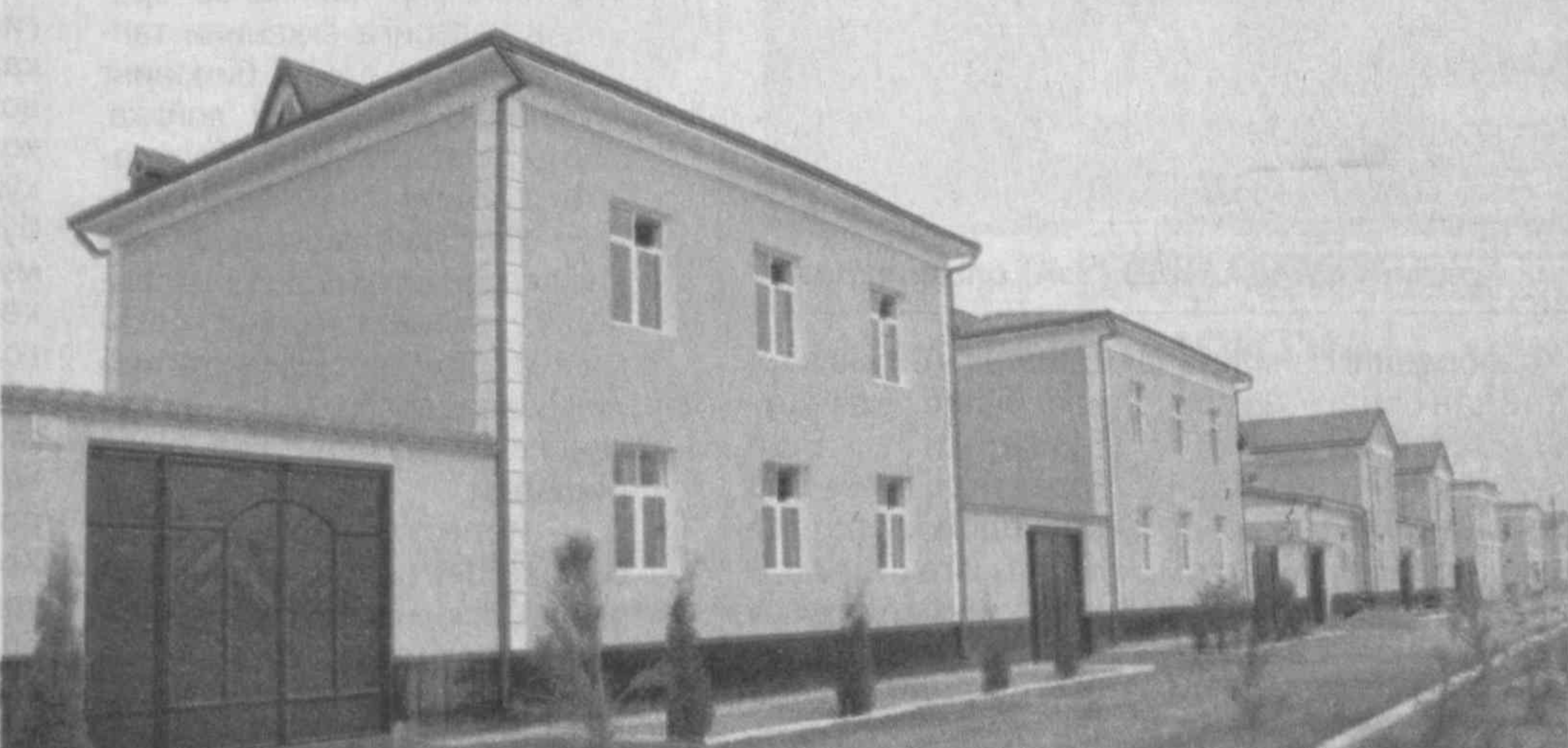
СУРАТДА: Наманган тумани Хонобод шаҳарчасидаги янги уйлар.

Ўттиз тўрт йилдирки, зардўзлик билан шугулланаман. Шу хунар этагидан тугтиб, сира кам бўлмадим. Бир пайтлар устозим Моҳира Жўраевдан зардўзлик сирларини ўрганганим. Бугун эса ўзим ёшларга устозлик қилаёман. Йигирма нафардан зиёд шогирдим бор.