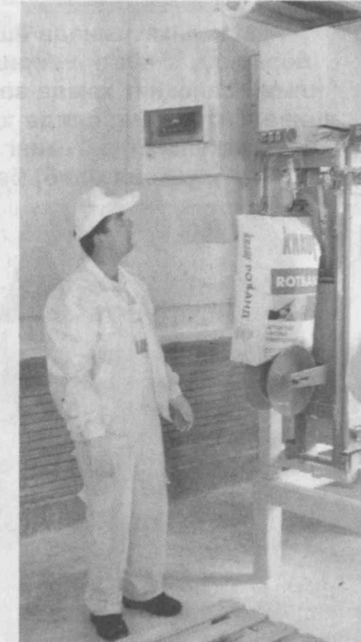
келгусида жамият салоҳиятини янада кенгайтириш имконини беради.

жиҳатдан янгилангани, модер- низация қилингани, табиийки, муваффақиятларга эришишда муҳим аҳамият касб этаётир.