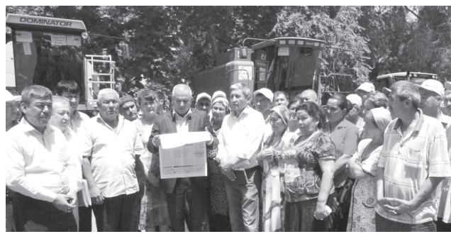
Давомий. Бошлиқни 1-бетда.

озиқ-овқат дастури ижросини таъминлашда муҳим ўрин тутди