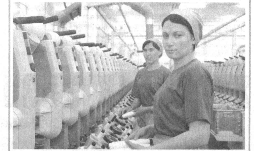
дим этилган ҳужжатлар тўпла-ди ўрганилмоқда. Жумладан, иқтисодиётнинг реал сектори корхоналарининг жами 178,6 млрд. сўмлик йирик инвести-

Банк жамоаси кичик биз-нес ва хусусий тадбиркорлик субъектларининг инвестиция-вий лойиҳаларини молиялаш-тиришга устувор вазифа си-фатида эътибор қаратмоқда. Натijaда иқтисодиётнинг жо-зибдор соҳасига йўналтири-лаётган маблағлар ҳажми йил сайин ортиб бораёпти. Айти-лик, кичик бизнесга 2009 йил-да барча молиялаш манбала-ридан 265,2 млрд. сўм ажра-тилган бўлса, 2010 йилнинг 1 июнига қадар ушбу мақсад-лар учун 161,7 млрд. сўм кре-дитлар (964 та лойиҳа учун) ажратилди. Бунинг ҳисоби-га, ўтган йилнинг шу давридаги-га нисбатан 802 та қўп, жами