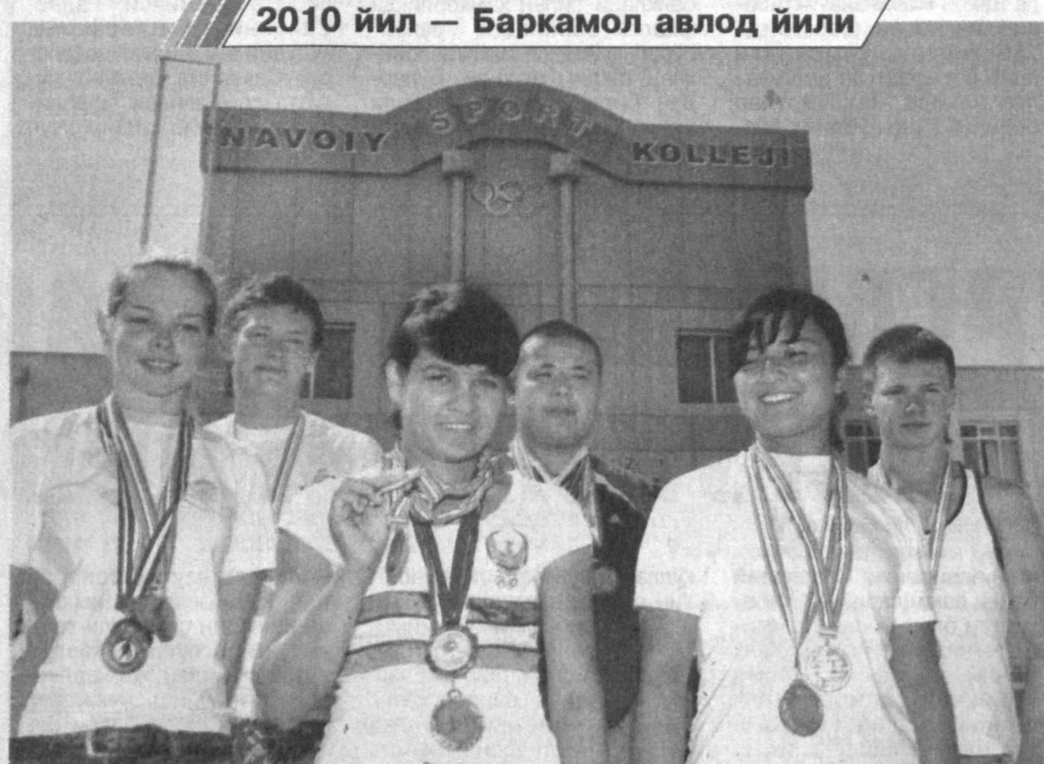
2010 йил — Баркамол авлод йили

бир бор ўз маҳоратини намойиш этиб, биринчи ўринни кўлга киритди. Дилором ушбу муваффақият эвазига олий ўқув юртига имтиёзга киритилган ва ёшлар ўртасида бўлиб