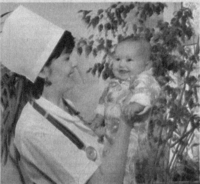
Буларнинг бари ҳар бир она билиши ва қатъий риоя қилиши лозим бўлган муҳим жиҳатлардир. Шу маънода, мазкур тушунчалар кизиларимиз, яъни бўлғуси оналар онгига ёшлиқдан оқиб синдириб борилса, мақсадга мувофиқ бўлур эди.

Ҳаётий кузатуваримизга таяниб айтишдан бўлса, бугунги кунда туғиш ёшидаги аёллар орасида биринчи фарзанди дунёга келганидан сўнг ўз соғлигини тўлиқ тиклаб олишга улгурмай туриб, яна ҳомиладор бўлиш ҳолатлари ҳали-ҳамон учрамоқда. Энг ёмони, ҳомиладорлик туфайли она сўтидан барвақт ажратилган гўдак ўсиш ва ривожланишда ортада қолиб, болани сунъий овқатлантириш жараёнида ҳар доим ҳам гигиена қоидаларига риоя қилинавермаслиги натижасида ўткир юқумли ичак хасталиклари келиб чиқиши мумкин.