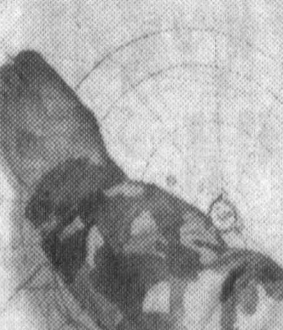
Бухоролик оддий аскар Тулқин Бобоқулов ҳам ана шундай фидойи жангчилардан бири.

— Бизнинг мақсадимиз, — дейди сержант, — Амир Темур, Жалолидин Манғуберди, Мирзо Бобур каби бошиқ аҳдодаларимиз аъналарига ҳақиқат содиқ бўлиб, она-Ватанимиз ҳаво сарҳадларини мустаҳкам ҳимоя қилишдир. Бунинг учун ҳарб илми санъатини пухта эгаллай бориб, ўз постинида савгак турибмиз, Бухоролик оддий аскар Тулқин Бобоқулов ҳам ана шундай фидойи жангчилардан бири. У барча тайёргарликларда фаол иштирок этиш билан бирга, жамоат ишларида ҳам жонбозлик кўрсатапти. Жумладан, бунимк мадеворий газетасига сайқал бериш, уни турли расмлар билан беазо — ранг-баранглигини оширишда салмоқли ҳисса кўшиб, ўзининг меҳнатсеварлиги билан уртак кўрсатди.