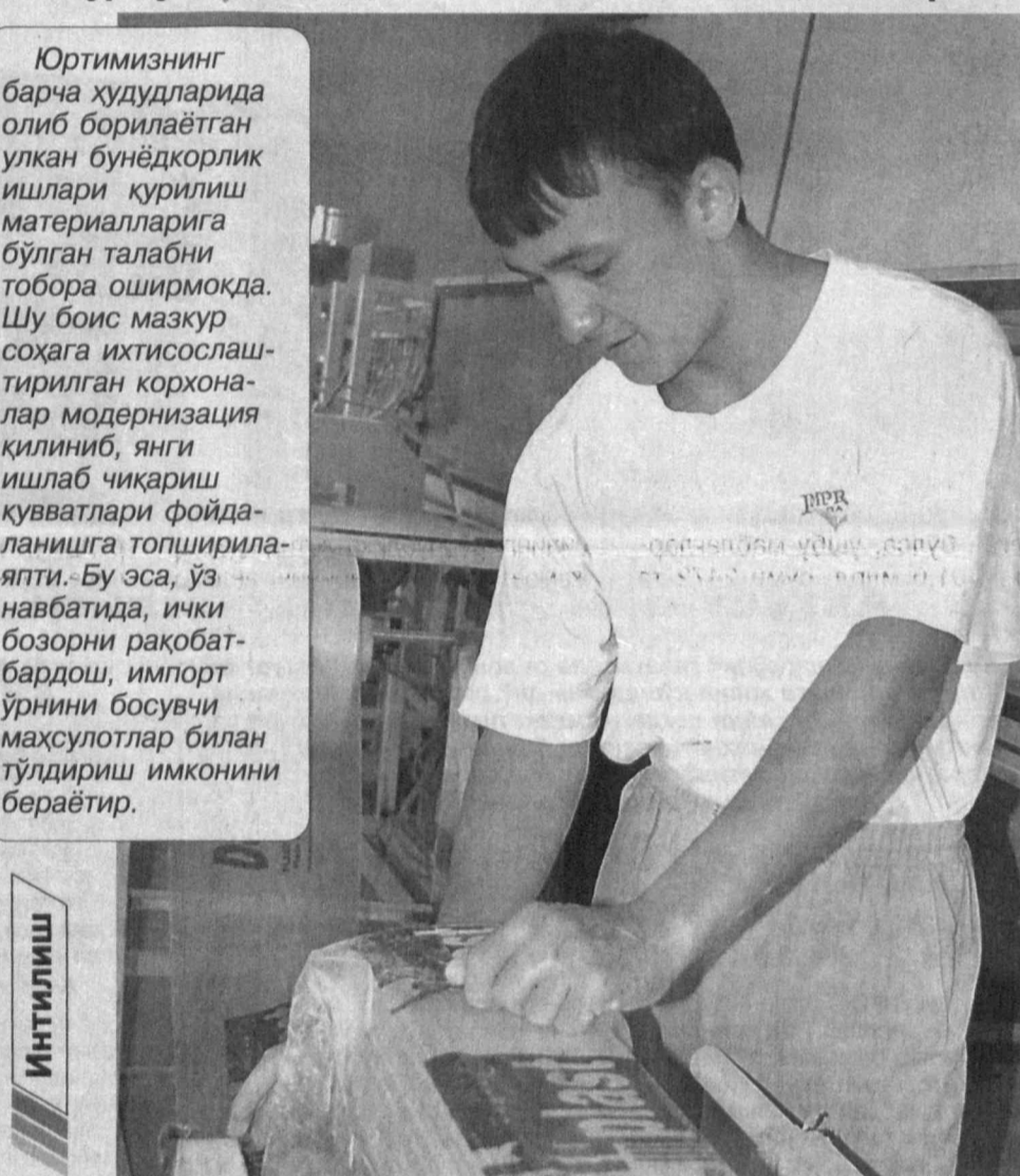
Юртимизнинг барча ҳудудларида олиб борилаётган улкан бунёдкорлик ишлари қурилиш материалларига бўлган талабни тобора оширмоқда.

Корхонада ишлаб чиқарилаётган маҳсулотлар аҳоли турмушини янада яхшилашга хизмат қилаётди.