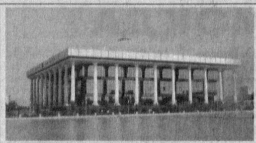
Парламентдаги муҳбиримиз хабар қилади.

Анжуманда депутатлар, қатор вазирилик ва идораларнинг раҳбарлари, мутахассислар ҳамда оммавий ахборот воситалари вакиллари иштирок этди.