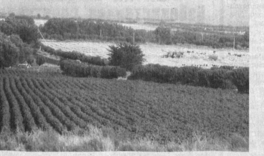
Хориж матбуоти хабарлари асосида тайёрланди.

Манбаларга қараганда, мазкур кўнгилсизлик апрель ойида юз берган бўлса-да, бу ҳақда кун кеча ошқор этилган. Мамлакат атом энергетика бошқармаси кўнгилсизлик реакторнинг совишти тизимида содир бўлганини ва бунинг оқибатида нурланиш кузатилмаганини маълум қилди. Шунингдек, мутасаддилар воқеа ҳодимлардан бирининг масъулиятсизлиги туфайли юз берганини ҳам маълум қилишган. Кези келганда айтиб